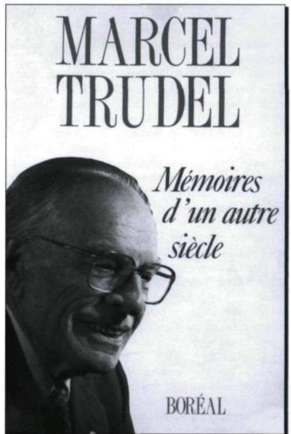
Page couverture des Mémoires d'un autre siècle , paru chez Boréal, en 1987.

M.T. : Oui, bien sûr. J'ai reçu bien des lettres après la publication de cet ouvrage. Un jour, j'en ai reçu une d'une personne qui disait à peu près ceci : «Je suis descendante d'un Noir esclave, j'ai consulté votre livre, j'ai fait ma généalogie et j'aimerais vous la montrer.» Elle était de la région de Vaudreuil, je crois. Je l'invite donc chez moi. Je m'attendais à voir arriver une Noire. Hé non! Elle était blanche et portait un nom bien québécois.