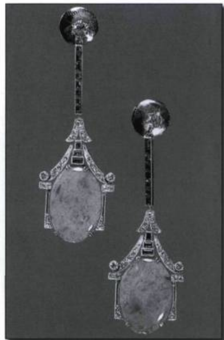
Pendants d'oreilles, influence chinoise, jade, émeraudes et diamants sur platine, vers 1925. (Archives de l'auteure).

Dans les années 1930, on s'entiche de l'alliance platine-diamants pour son «look tout blanc». On aime également les bijoux massifs, audacieux et géométriques sans ajouts décoratifs.