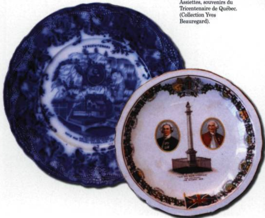
Assiettes, souvenirs du Tricentenaire de Québec. (Collection Yves Beaugard).

Les Québécois avaient pris goût aux anniversaires. En 1892, ils célébrèrent même Christophe Colomb avant les Américains. Le 12 octobre, se tenaient des «fêtes colombiennes» à l'occasion du 400 e anniversaire de la découverte de l'Amérique. Il y eut une grand-messe à la basilique, une séance à l'Académie de musique et une soirée littéraire et musicale préparée par l'Institut canadien. Les Américains n'auront leur Exposition colombienne que l'année suivante.