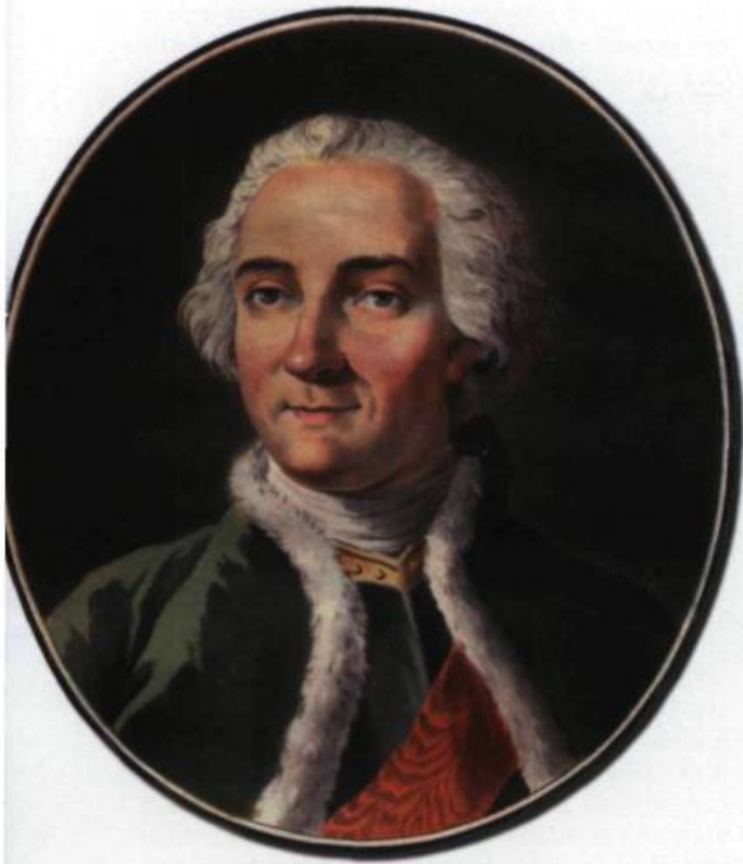
Portrait de Louis-Joseph de Montcalm, aquarelle de Sergent éditée à Paris, en 1790.

le rôle de Québec comme bastion de la francophonie et avaient fait la preuve que les Québécois pouvaient organiser de grandes célébrations.