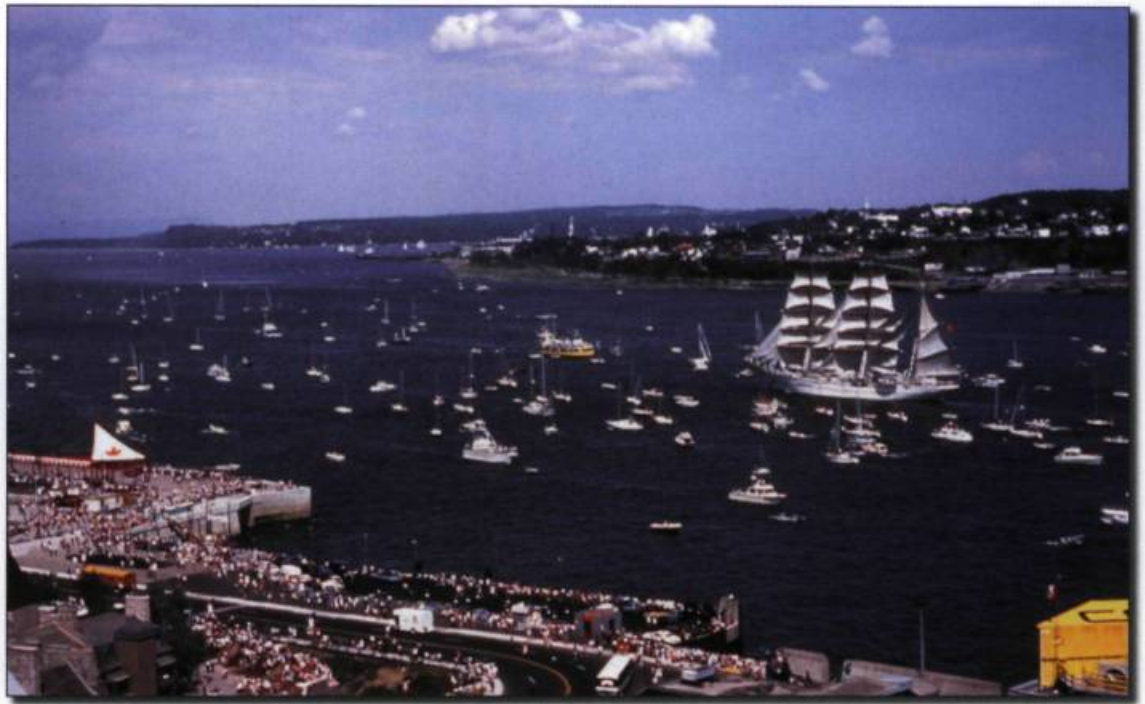
Le Sagres II, grand voilier portugais, partant de Québec au terme des fêtes de Québec 1534-1984.

Maurice Duplessis. Les fêtes se déroulèrent jusqu'au 6 juillet et furent l'occasion d'un défilé historique, de feux d'artifice sur les plaines d'Abraham, d'une messe pontificale et