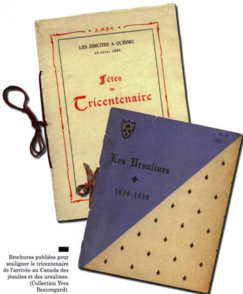
Brochures publiées pour souligner le tricentenaire de l'arrivée au Canada des jésuites et des ursulines.