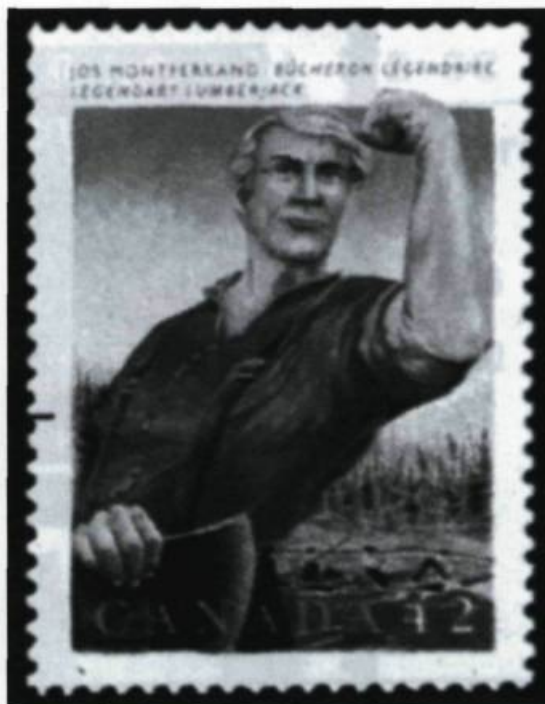
Le 8 septembre 1992, Postes Canada a émis un timbre de 42 ¢ honorant Jos Montferrand. (Collection Yves Beauregard).

De tous les hauts faits de notre athlète, le plus extraordinaire demeure sa légendaire bataille sur le pont Union, en 1829 (aujourd'hui le pont des Chaudières). Ce pont, le seul lien terrestre entre Hull et Bytown, est alors le théâtre d'un conflit qui oppose des fiers-à-bras irlandais, les Shiners, aux Canadiens français. Les deux groupes se disputent âprement la mainmise sur les emplois dans l'industrie forestière de la vallée de l'Outaouais. Les bagarres entre les deux groupes ethniques sont fréquentes et un climat de violence règne dans la région, particu-