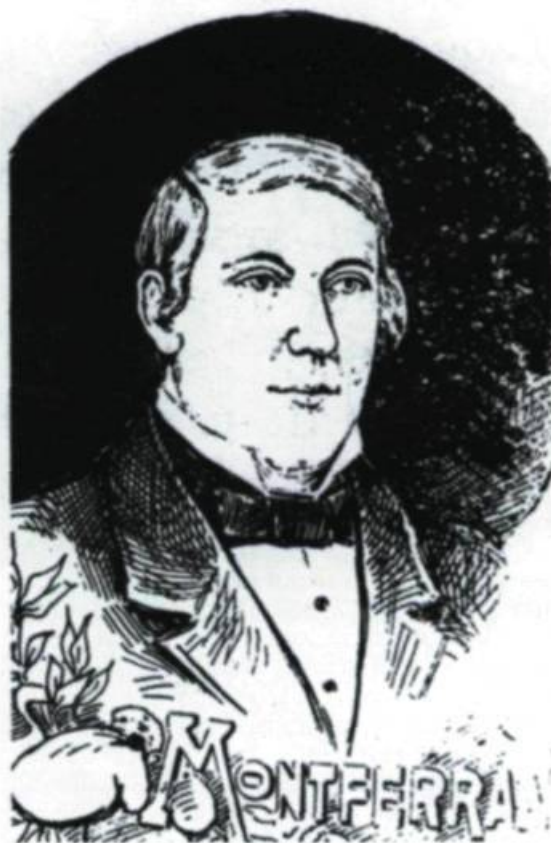
Portrait de Jos Montferrand par Henri Julien. Il est né à Montréal, en 1802. Tout à tour, il a été charretier, employé dans le commerce des fourrures, conducteur de cages de bois. ( Nos racines , n° 79, p. 1 563).

Les exploits de Montferrand commencent dès l'âge de 16 ans. En 1818, il rosse trois fiers-à-bras qui terrorisent son quartier. À la même période, il relève devant ses admirateurs le défi d'un boxeur anglais qui s'était proclamé