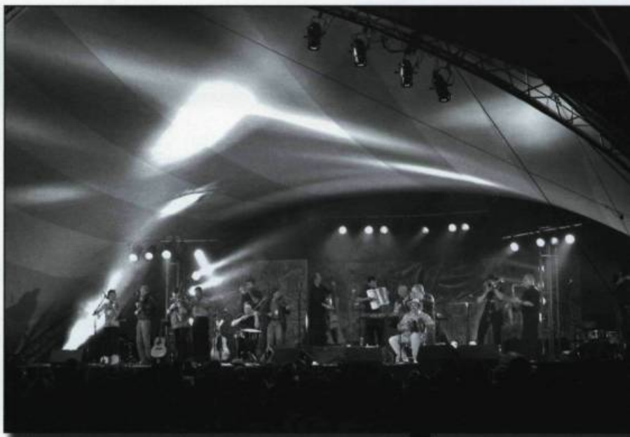
Spectacle Mémoire et racines à Saint-Charles-Borromée, 2001.

Grâce à ces productions, La Bottine Souriante obtient enfin le soutien médiatique qui lui manque et effectue une percée importante auprès du public montréalais, puis successivement dans les villes de Québec, Toronto, Winnipeg, Burlington, Denver, Chicago et Pittsburgh. Sur scène, neuf musiciens sont réunis et le concept artistique joue à la fois sur le pouvoir de socialisation, les qualités esthétiques et le potentiel identitaire de la musique traditionnelle. Deux disques de facture «ethno-pop» ou «rock'n reel» émergent de cette période productive : Jusqu'aux p'tites heures , en 1991, et La Mistrine , en 1994, des œuvres qui marquent définitivement toute notre conception de la musique traditionnelle québécoise. Le nouveau style musical, corsé et raffiné, est un fin mélange de répertoire traditionnel soigneusement choisi pour ses qualités structurelles et d'arrangements originaux, modernes et percutants du point de vue de l'écriture harmonique, rythmique et orchestrale.