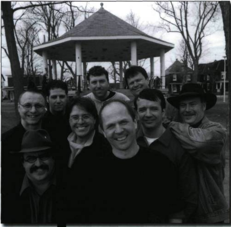
La Bottine Souriante, 2001.