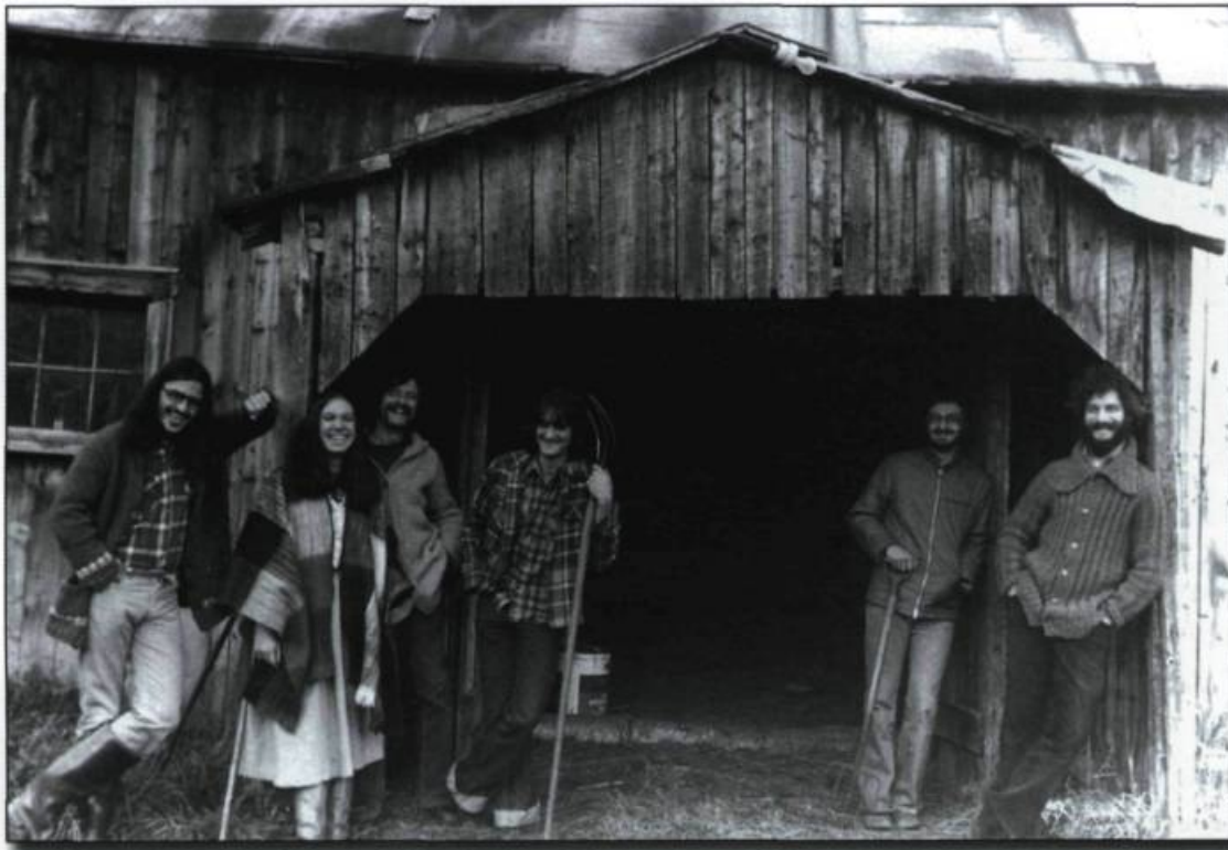
■ Les Épousailles , album de 1978.

Rapidement, La Bottine Souriante est associée à la cause indépendantiste à titre de sauveurs du folklore québécois. Les conséquences de cette association sont négatives. Le second microsillon n'obtient pas autant de succès, malgré une belle qualité musicale. C'est que la sortie des Épousailles , en 1980, coïncide avec la défaite du projet d'indépendance proposé par le Parti québécois.