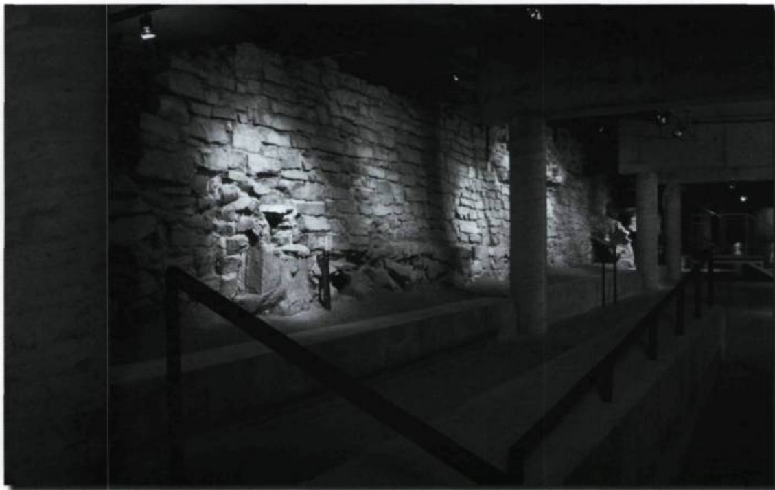
■ Mur des fortifications. Pointe-à-Callière, musée d'archéologie et d'histoire de Montréal.