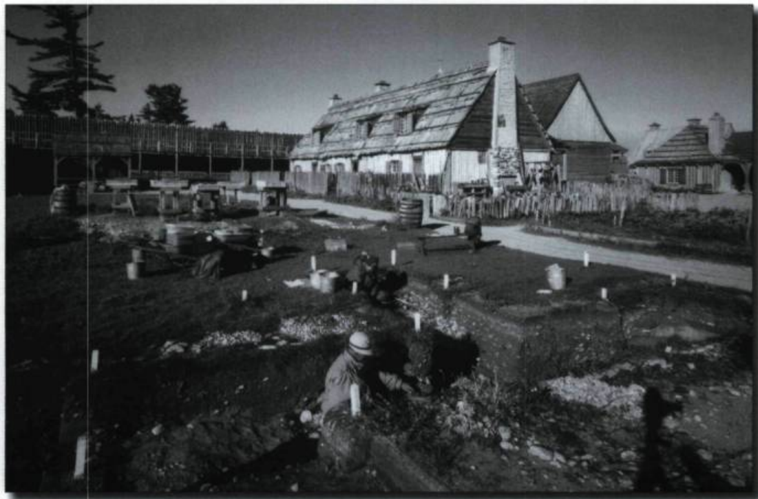
À Colonial Michilimackina, les visiteurs peuvent examiner les bâtiments reconstruits et regarder les fouilles.

Puisque autant d'autochtones vivent dans cette région stratégique sur le plan géographique, la traite des fourrures se développe rapidement. En 1683, le gouvernement colonial fonde le fort de Buade dans le but de régler le commerce et les commerçants. En 1701, Antoine Laumet, dit de Lamothe Cadillac, dernier commandant de fort de Buade, obtient du monarque français la permission de déménager le poste à Détroit.