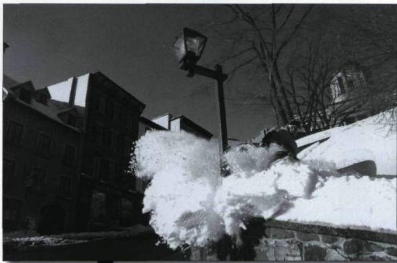
Partout où il y a de la neige... (Photo : Sébastien Larose ©).