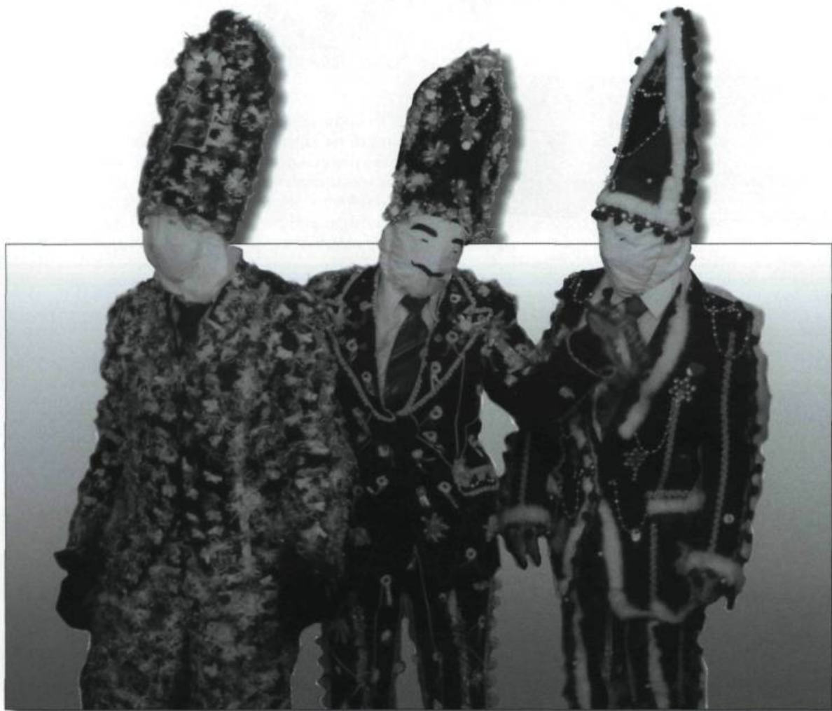
Costumes des galonnés de l'Île-aux-Grues.