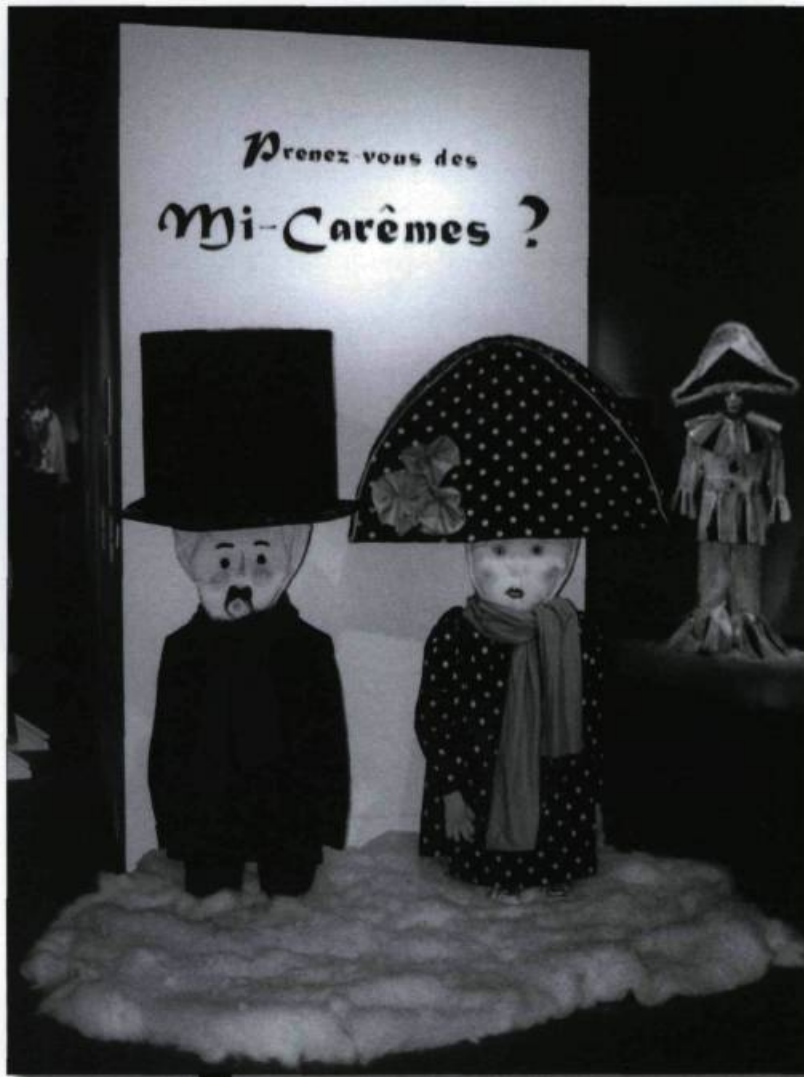
Entrée de l'exposition Prenez-vous des mi-carêmes? , présentée au Moulin des Jésuites, en 1996.

Les costumes à thèmes sont aussi apparus, plus beaux et raffinés chaque année : sirènes, toréadors, trolls, etc. Pendant des mois, des groupes de sept ou huit femmes se forment et s'affairent dans le plus grand secret, et elles assurent qu'« il y a autant de plaisir à faire les costumes qu'à les porter.» Un vidéo intitulé : Prenez-vous des Mi-carêmes? fut tourné en 1994-1995 et témoigne de la participation des résidents de l'île et de l'élégance de leurs costumes.