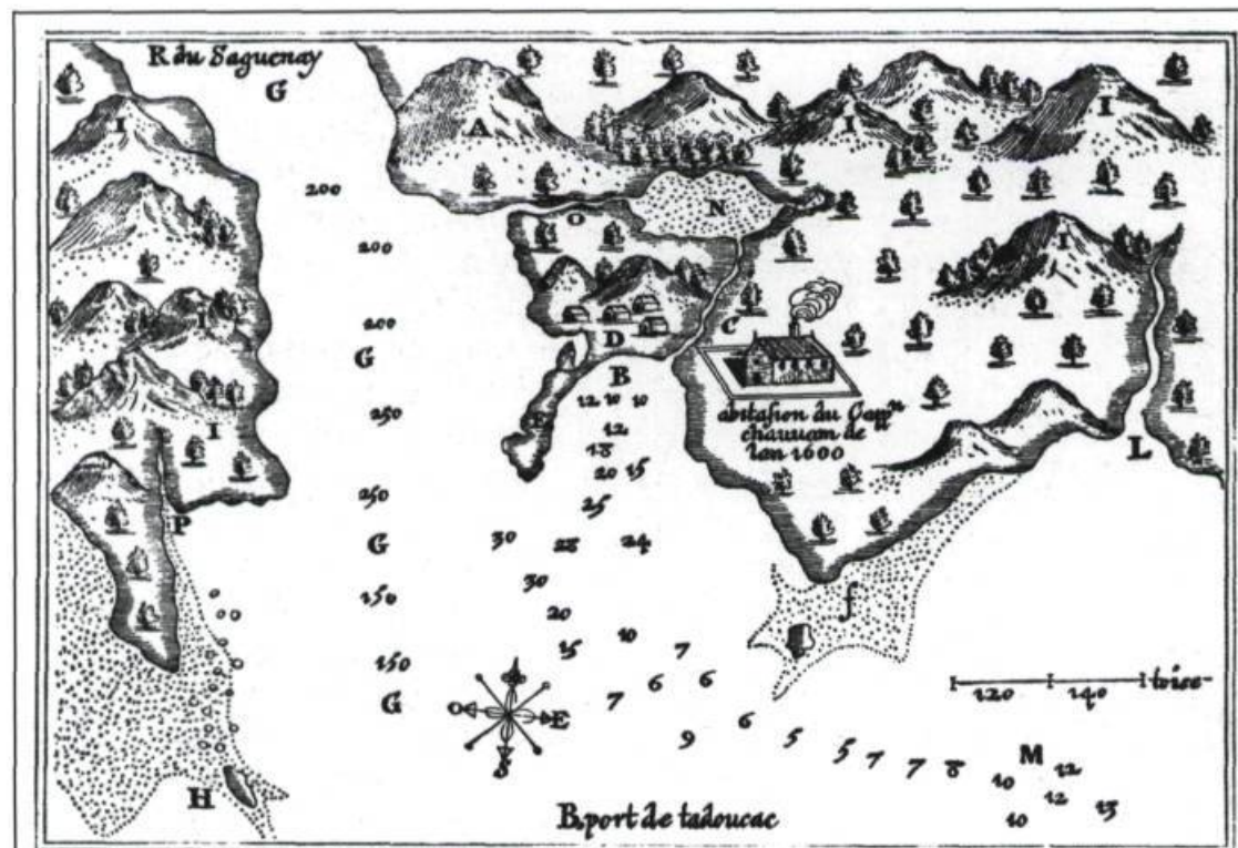
Les chiffres montrent les brasses d'eau.

Le 24 mai 1603, Samuel de Champlain débarque à Tadoussac en compagnie d'Aymar de Chaste, le nouveau détenteur du monopole. S'il est déçu par le port de Tadoussac, trop petit à son goût, et par les terres environnantes, trop escarpées, c'est pourtant là qu'est scellé le sort des Français dans la vallée du Saint-Laurent.