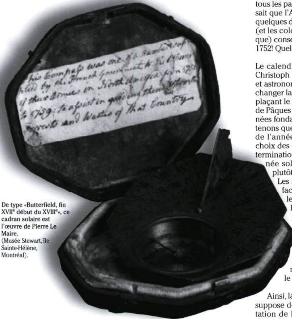
De type «Butterfield, fin XVII e début du XVIII e », ce cadran solaire est l'œuvre de Pierre Le Maire. (Musée Stewart, île Sainte-Hélène, Montréal).

Finalement, le gnomon du cadran ne sera plus vertical, mais monté en parallèle avec l'axe de la rotation de la Terre. Le style devient aligné sur l'axe nord-sud, empruntant l'angle d'inclinaison correspondant à la latitude du lieu, mais il demeure horizontal à l'équateur et seulement ver-