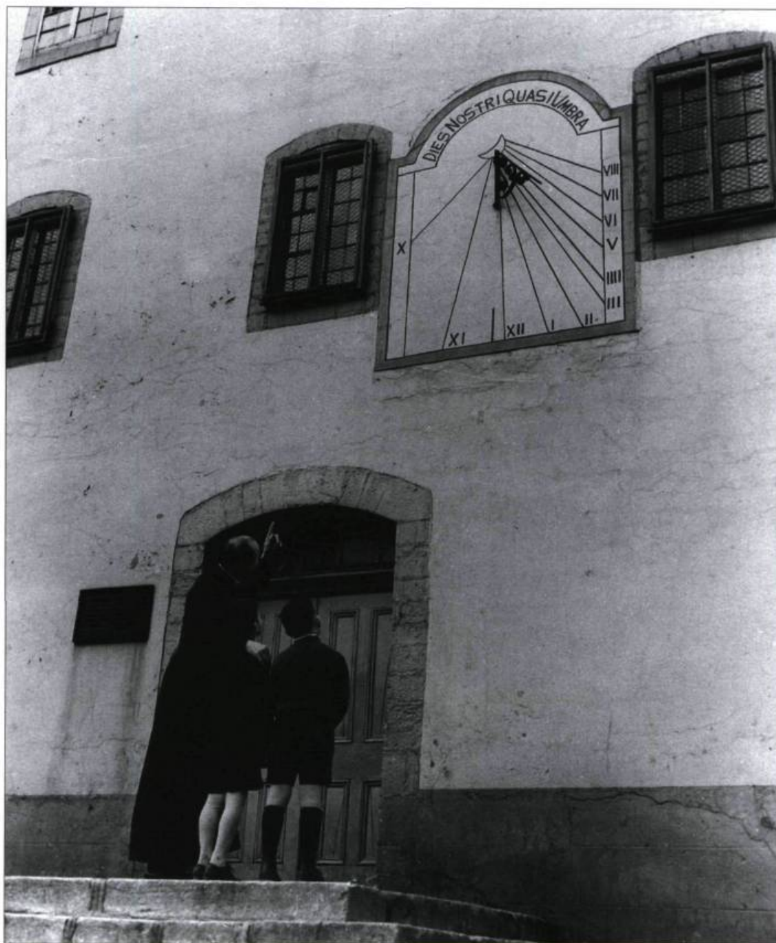
Cadran solaire du Petit Séminaire de Québec datant de 1773. Photographie Canadian Pacific Railway Company, 1949. (Archives de Cap-aux-Diamants ).

des cadrans solaires et à leur fabrication pour comprendre l'engouement qu'ils provoquent, avec des degrés variables de difficultés, du plus simple au plus complexe, selon les âges, les niveaux d'instruction, la dextérité manuelle, et l'amour et le souci du beau. Pour s'initier à l'astronomie, le cadran solaire est merveilleux : il permet l'intégration de notions d'astrophysique et de gnomonique, sans négliger l'apport des mathématiques. Un cadran solaire peut demander beaucoup de calculs et de précision, mais il permet facilement la domestication des ombres sous l'influence du Soleil. Un cadran solaire réussi, du plus simple au plus sophistiqué, procure un sentiment de fierté à son auteur. C'est se donner un pou-