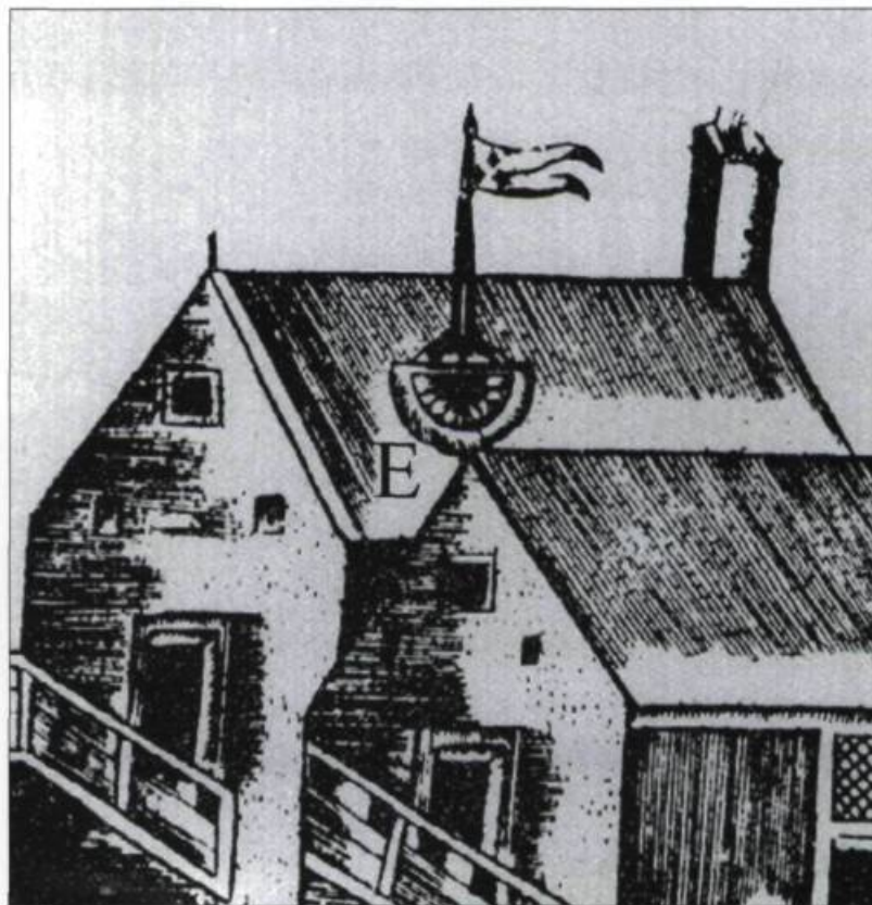
Abitation de Quebeq (détail). Le cadran solaire est indiqué par la lettre E.