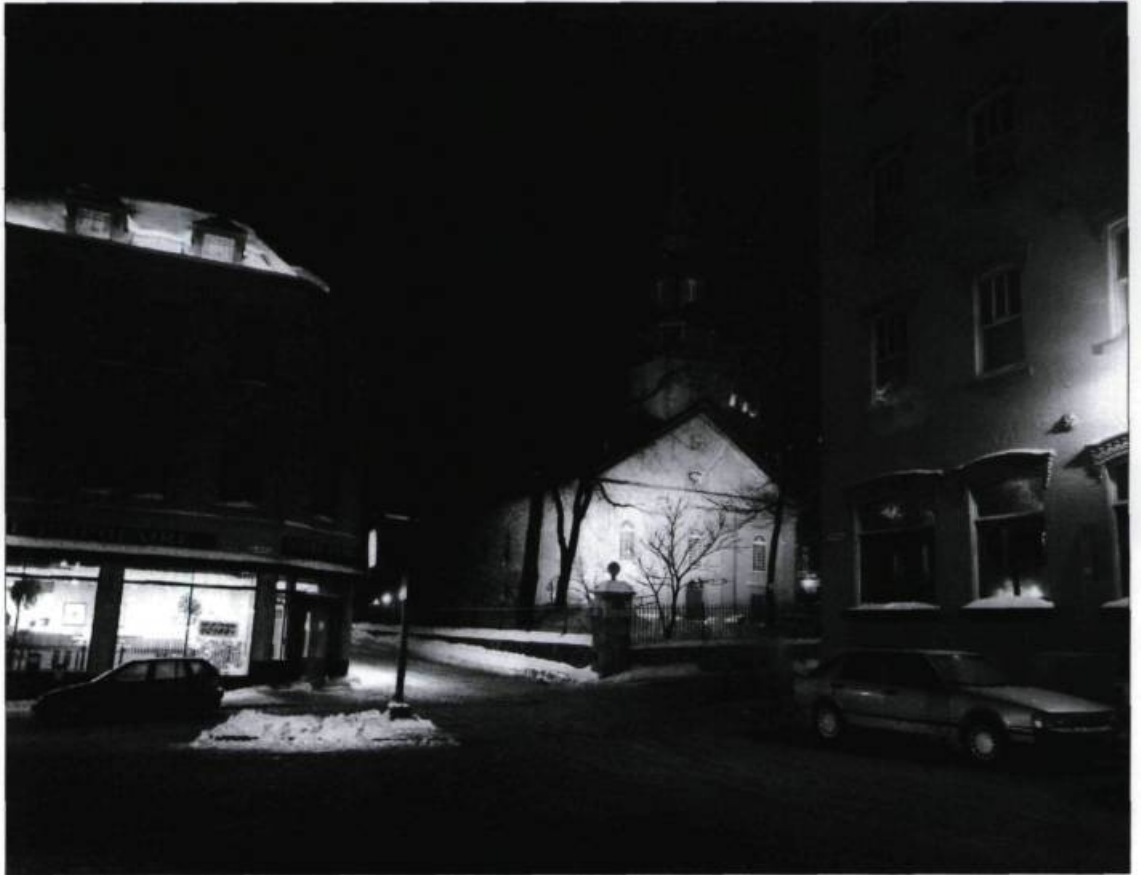
Cette photographie prise de nuit au cours de l'hiver 1989 donne une bonne idée de l'environnement exceptionnel de la Caisse populaire Desjardins du Vieux-Québec, près du vieil hôtel Clarendon et de la cathédrale Holy Trinity.

Le 29 avril 1964, la Caisse populaire devint propriétaire de son édifice actuel qui fait le coin nord-est des rues Sainte-Anne et des Jardins, à quelques pas de l'hôtel Clarendon, de l'hôtel de ville et de l'édifice Price. Dans l'esprit des vieux