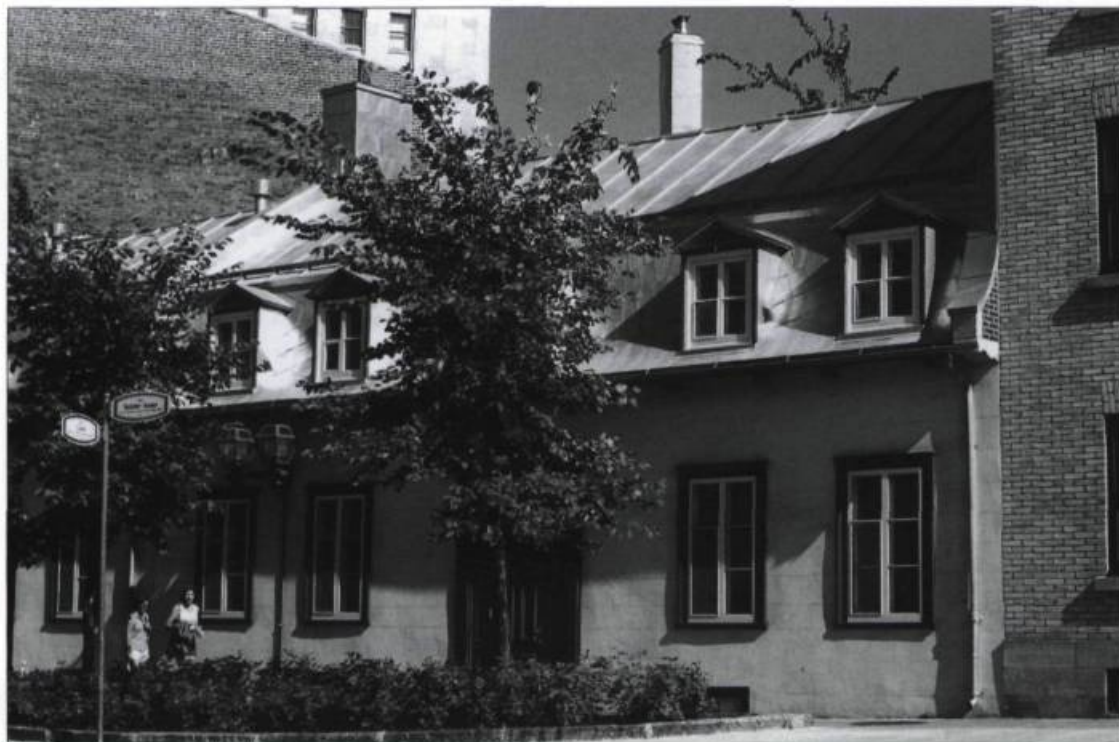
En 1948 et 1949, la Caisse loge dans une propriété appartenant à Gérard Dutil, au 87, rue Sainte-Anne. Photographie Yves Beauregard, 1999. (Archives de Cap-aux-Diamants).