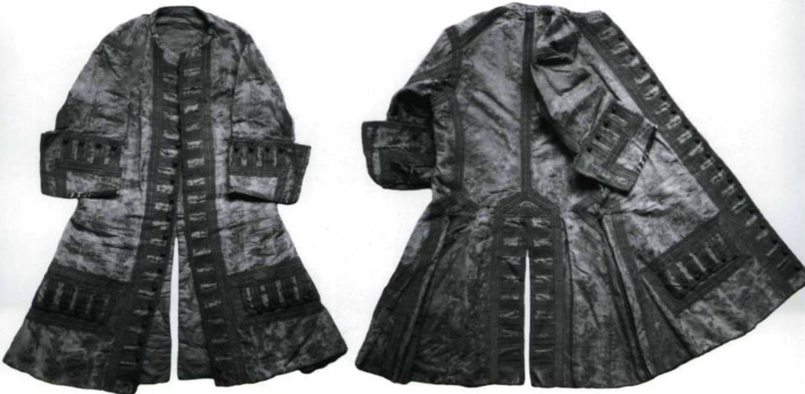
Ce «justaucorps» français datant du règne de Louis XIV est l'un des deux seuls exemplaires connus qui seraient parvenus jusqu'à nous. Voici comment Pierre Richelet décrivait le justaucorps à la fin du XVII e siècle : «Vêtement d'homme, qui est proportionné au corps, qui se boutonne comme un pourpoint et qui descend jusqu'aux genoux, qui a des manches retroussées [...] et des poches sur le devant». (Collection privée, photo : Francis Back)

Les justaucorps que l'on trouve chez l'«habitant» sont taillés dans de robustes étoffes et sont de couleur brune ou grise. Ceux de l'élite coloniale affichent, quant à eux, un luxe qui est parfois outrancier. Ainsi, peut-on