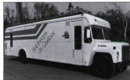
Le Bibliobus parcourt les rues de la ville de 1979 à 1986.

1972 Célébrations du 125 e anniversaire. Fête populaire à la place Royale.