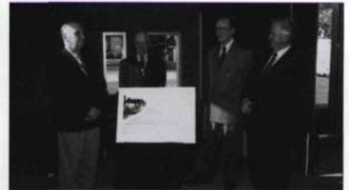
Inauguration de la bibliothèque Jean-Baptiste-Duburger, en présence du maire Jean-Paul L'Allier, en 1997.

1993 Les festivités «Dix chandelles pour Gabrielle!» soulignent le 10 e anniversaire de la bibliothèque Gabrielle-Roy. / En 1993 et 1994, L'Institut réévalue sa mission.