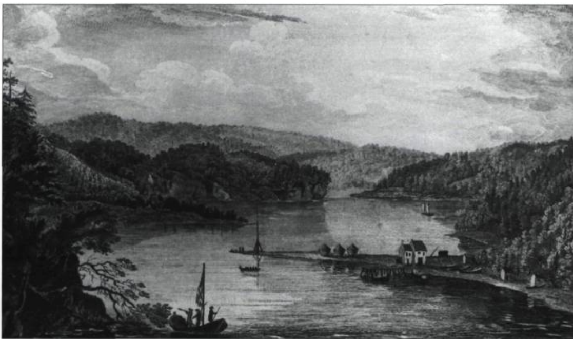
«L'établissement de Pierre Revol dans la baie de Gaspé en 1758». Trois cents personnes travaillaient à la pêche de la morue pour ce marchand de Québec. On voit ici, empilés à l'extrémité de la pointe de terre, 2 000 quintaux de morue prêts à l'embarquement. Dessin d'Hervey Smyhte, 1760, in Gentlemen Magazine , London.

La morue est omniprésente sur le littoral. Les voyageurs ne peuvent faire autrement que de la remarquer. Son odeur flotte partout. On la voit étendue sur les grèves. On s'en nourrit, on se soigne avec son huile. «C'est le pays de la morue», écrit Jean-Baptiste Ferland en 1836. «Par les yeux et par les narines, par la langue et par la gorge, aussi bien que par les oreilles, vous vous convaincrez bientôt que, dans la péninsule gaspésienne, la morue forme la base de la nourriture et des amusements, des affaires et des con-