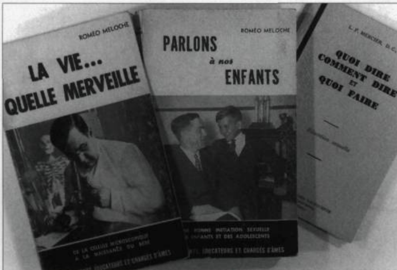
Ouvrages québécois d'éducation sexuelle publiés en 1930 et en 1940.

Entre 1940 et 1960, l'expansion urbaine et industrielle, le développement des moyens de communication et de la consommation de masse engendrent et accentuent des pratiques sociales inédites. La diffusion des savoirs nouveaux sur la sexualité, la transformation des rapports familiaux, la valorisation de la jeunesse, bref toute une série de tendances novatrices pénètre et relance les réflexions sur la sexualité. Si les tenants des codes prescriptifs traditionnels se manifestent encore de façon bruyante et persistante dans l'après-guerre, ils sont contraints de se retrancher dans une attitude défensive. En dépit des structures traditionnelles, les forces de changement travaillent la société québécoise. L'État se voit pressé d'intervenir pour harmoniser l'ensemble des transformations sociales. Les intervenants nouveaux dans le domaine de la vie familiale et sexuelle se multiplient : éducateurs réformistes, service social moderne, médecins, psychologues. L'éducation sexuelle familiale devient une nécessité des temps