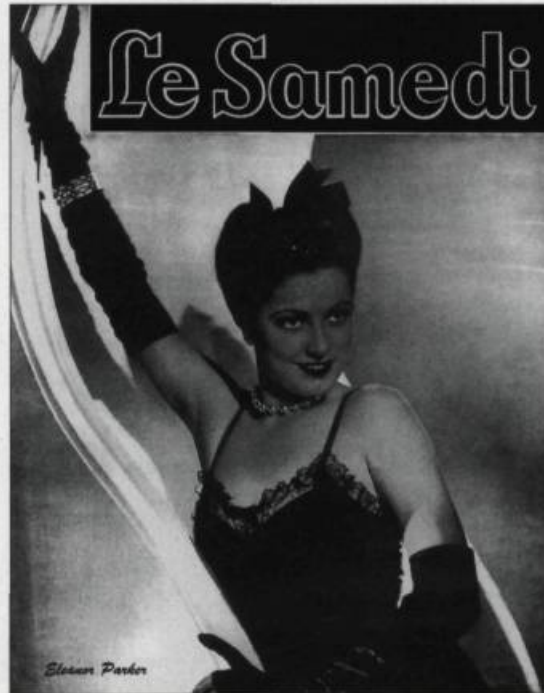
Dès le début des années 1940, les revues québécoises présentent en couverture les vedettes d'Hollywood : ici, Eleanor Parker dans Le Samedi en 1942.

Les travaux touchant l'histoire de la sexualité au Québec restent encore relativement peu nombreux. Cette situation peut paraître étonnante