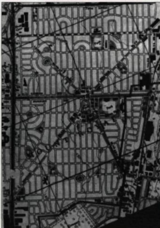
Plan de la cité-jardin de Ville Mont-Royal dessiné par Frederick Todd. Les rues courbes et les nombreux espaces verts de ce quartier résidentiel, inspiré par le modèle de Ebenezer Howard sont découpés par de grands boulevards selon la tradition formaliste de la City Beautiful . (Extrait d'une carte préparée par le Service de cartographie du ministère de la Défense in Marsan J.C. (1983). «Montréal, une esquisse du futur»).

J.-C. Marsan, (1983). Montréal, une esquisse du futur . Québec : Institut québécois de recherche sur la culture, 322 p.