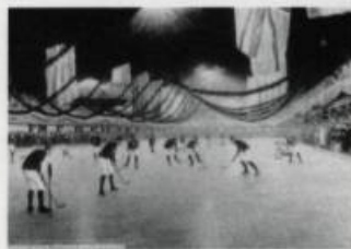
« Partie de hockey, patinoire Victoria 1893 ».

« Les grands prix de l'Institut de Design de Montréal »