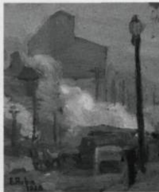
Ernest Aubin : « Rue des Commissaires », 1928. (Coll. Jean-Albert Contant)

« Peindre à Montréal 1915-1930 : les peintres de la Montée Saint-Michel et leurs contemporains »