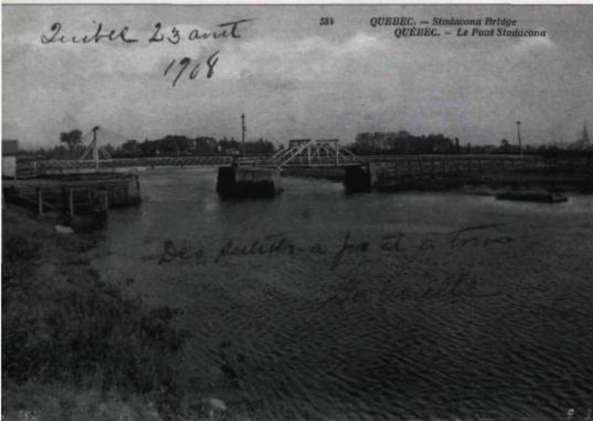
Le pont Stadacona, ou pont Bickell, permettait aux gens de Stadacona de se rendre à Québec à travers la Pointe aux Lièvres. Carte postale N.D., 1907.

La construction des grands voiliers déclina après 1867. L'engouement des armateurs britanniques pour les navires en fer et en acier condamna nos chantiers. Un à un, ils cessèrent leurs activités. Mackay et Warner quittèrent, mais à la fin des années 1920, on pouvait encore voir leur grande et haute maison, surmontée de multiples cheminées.