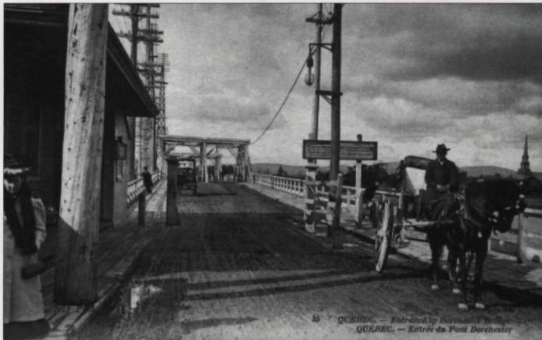
Entrée du vieux pont Dorchester au bout de la rue du Pont. On aperçoit au loin le clocher de l'ancienne église de Saint-Charles de Limoilou. Du côté gauche, se dresse la maison du gardien du pont. Carte postale N.D., 1907. (Collection Yves Beauregard).

souvent que des loup-marins se soient aventurés ainsi dans la rivière Saint-Charles».