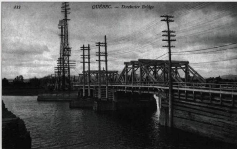
317 QUÉBEC. — Dorchester Bridge Le vieux pont Dorchester n'avait pas suivi le progrès. Il était encore un pont à péage alors que de modernes pylônes d'électricité amenaient le courant de la centrale de la chute Montmorency à Limoilou et Québec. Carte postale N.D., 1907.