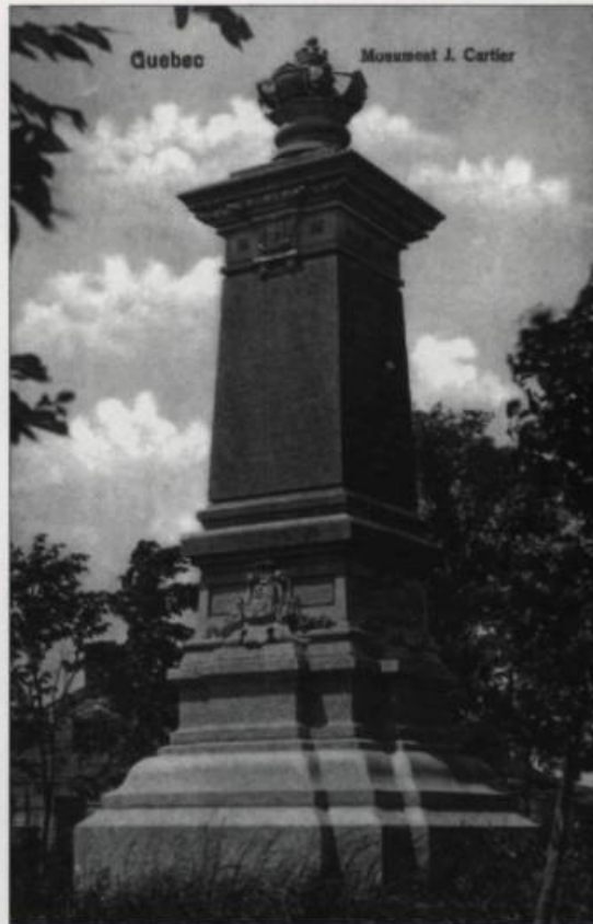
Le monument Cartier-Brébeuf est l'œuvre de Eugène-Étienne Taché. Il fut inauguré le 24 juin 1889. Carte postale Illustrated Post Card Co. Montréal. (Collection Yves Beauregard).

Il n'y avait pas que le tommy cod qui fréquentait la rivière Saint-Charles, il y avait aussi les loup-marins! Après nous avoir décrit un loup-marin étendu sur le sable et se prélassant à son aise sous les rayons du soleil, Le Journal de Québec du 14 juillet 1868 soulignait : «Il est arrivé assez