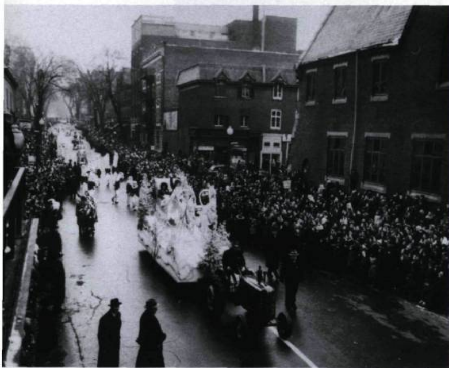
Le défilé d'Eaton parcourt plusieurs quartiers populaires de Montréal, à l'ouest mais aussi à l'est de la rue Saint-Laurent. Photographie non identifiée, 1945. (Fonds Eaton. Archives de l'Ontario, Toronto).

« Q UE LA BONNE NOUVELLE SE RÉPANDE PARTOUT... afin que tous viennent samedi, à la Ville des jouets, la Ville enchantée, la Ville féerique, plus belle, plus grande, plus brillante, plus gaie que jamais».