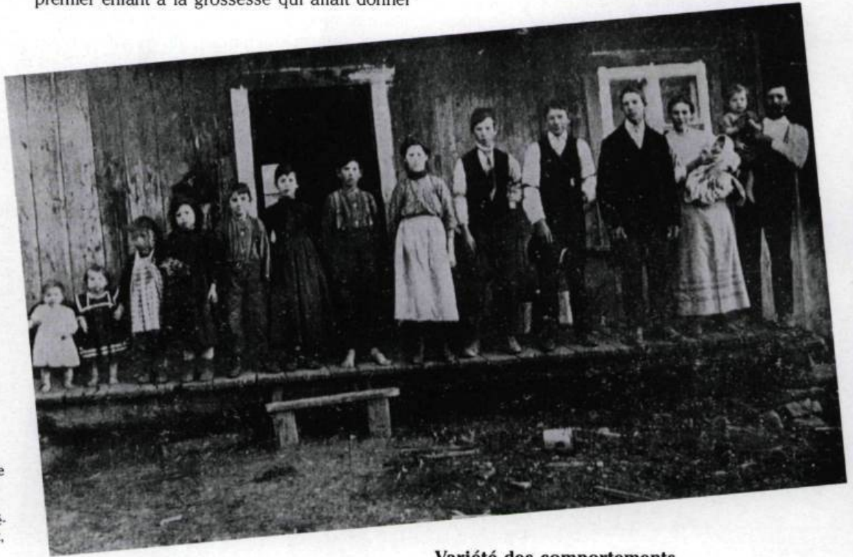
Une famille canadienne typique vers 1900. (Alex Girard. «La Province de Québec». Québec: Dussault et Proulx, 1905).

et ce n'est qu'au bout de vingt ans de mariage que le dernier apparaissait. D'autre part, plusieurs étaient emportés par la mort et ce prélèvement n'était pas minime: un quart des enfants mouraient avant d'atteindre leur premier anniversaire, un tiers avant d'atteindre 15 ans.