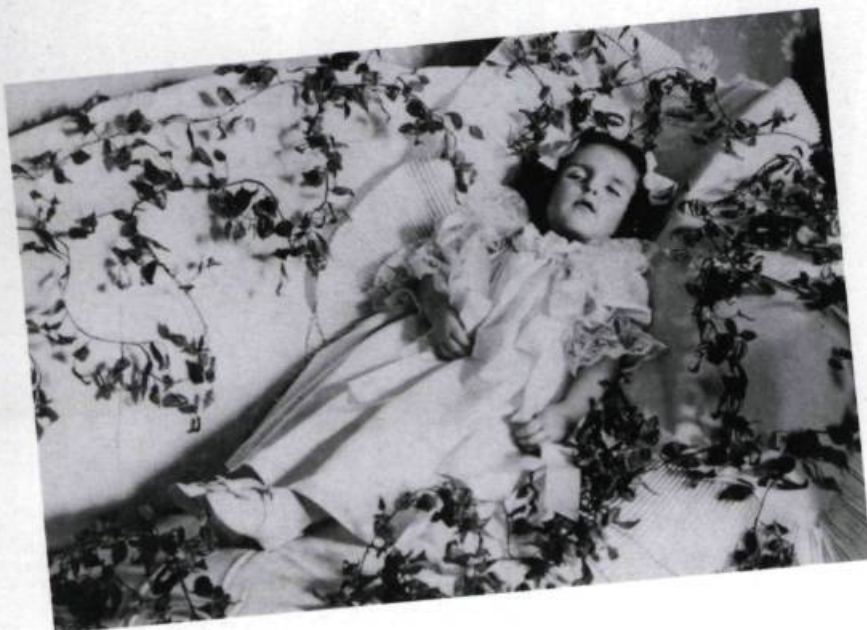
Longtemps la mort a prélevé de lourds tributs parmi les jeunes Québécois: un quart des enfants mouraient avant d'atteindre leur premier anniversaire, un tiers avant d'atteindre 15 ans.

Entre temps, les «grosses familles» étaient pratiquement disparues. Mais elles ont perduré plus longtemps qu'on ne le croit souvent. Les Québécoises qui se sont mariées entre 1946 et 1950 ont mis au monde quatre enfants en moyenne; un tiers d'entre elles ont eu cinq enfants ou plus, ce qui se classe aujourd'hui dans les «grosses familles»; celles qui se sont mariées dix ans plus tard ont eu un enfant de moins en moyenne (4,0) et un sixième seulement ont atteint cinq enfants; chez les nouvelles mariées de 1966-1971, pour une descendance moyenne un peu plus faible (2,4 enfants), on ne trouve que moins de deux pour cent des femmes qui ont eu au moins cinq enfants. Il a suffi de vingt ans pour que ces familles nombreuses n'existent plus qu'à l'état de trace de l'Ancien Régime.