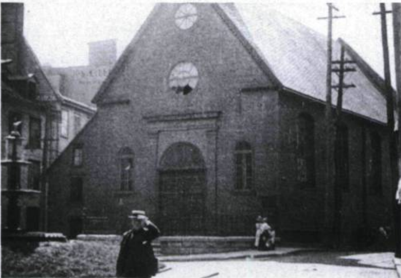
Quelques scènes tirées d'un film sur la ville de Québec en 1918. (Archives de la Cinémathèque québécoise).

avons retrouvé le film dans lequel elle avait tourné en 1912, A Sailor's Heart , et en 1981 nous avons présenté publiquement ce film en présence de l'actrice principale, alors âgée de 85 ans! Nous avons obtenu la collaboration du Château Frontenac qui a accepté gracieusement de loger à nouveau Blanche Sweet, et nous avons même réussi, grâce au curé d'une paroisse de l'île d'Orléans, à dénicher une famille québécoise typique, pour offrir à Blanche Sweet un repas québécois inoubliable, avec bien sûr des pommes de terre bouillies!