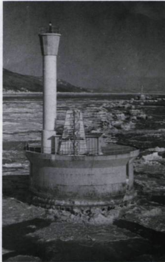
(A et B) Les feux d'alignement de Banc-Brûlé: le premier et le second phare.