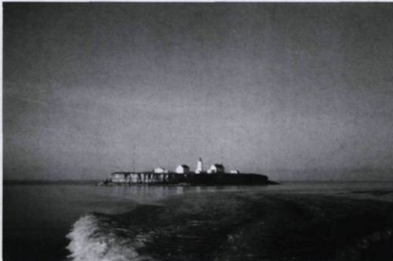
L'île aux Perroquets.

Au large, du côté nord de l'île d'Anticosti, se trouve l'île aux Perroquets, nommée ainsi à cause des macareux qui viennent pondre autour de l'immense rocher sur lequel on a érigé un phare en 1888.