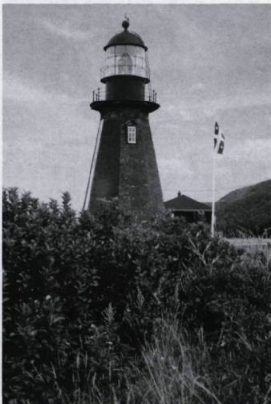
Phare de Rivière-à-la-Martre (Gaspésie).

Le phare fut d'abord occupé par le comte Henri de Puyalon, né au château de l'Orb, près de Bordeaux. Marié à Angéline Ouimet, fille d'un ex-premier ministre du Québec, le comte de Puyalon, en plus de surveiller le phare, écrivait des