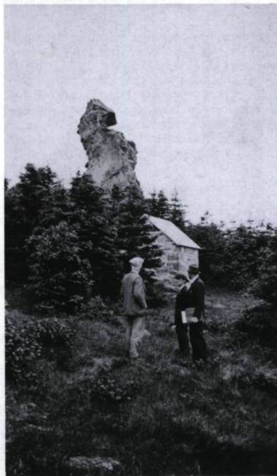
La cache à provisions devenue la poudrière Cap-Chat (Gaspésie).

Le 11 octobre 1966, les deux piliers sont installés et prêts à entrer en fonction. De forme circulaire et peints en rouge, ils sont faits de béton armé recouvert d'acier. Celui à l'est a un diamètre de 15,6 mètres et domine de 3,9 mètres le niveau de la mer. La base supporte une habitation en béton, peinte en blanc, surmontée d'une tour en ciment, qui fait 23,3 mètres de hauteur et 1,8 mètre de diamètre. Quant au pilier ouest, sa tour s'élève à une quinzaine de mètres et mesure 2,3 mètres de diamètre. Elle est dépourvue d'habitation, contrairement au plan original.