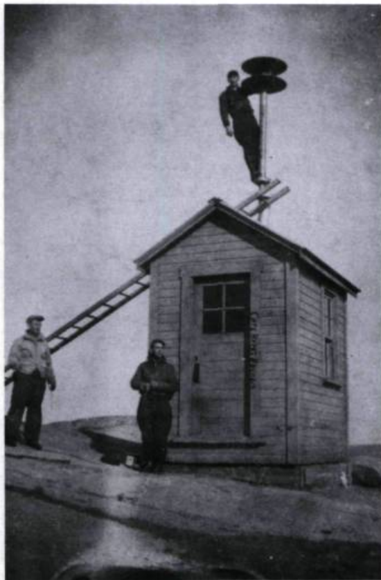
Canon à acétylène de l'île du Grand Caouis (Cavoce Island) le 11 mai 1936.