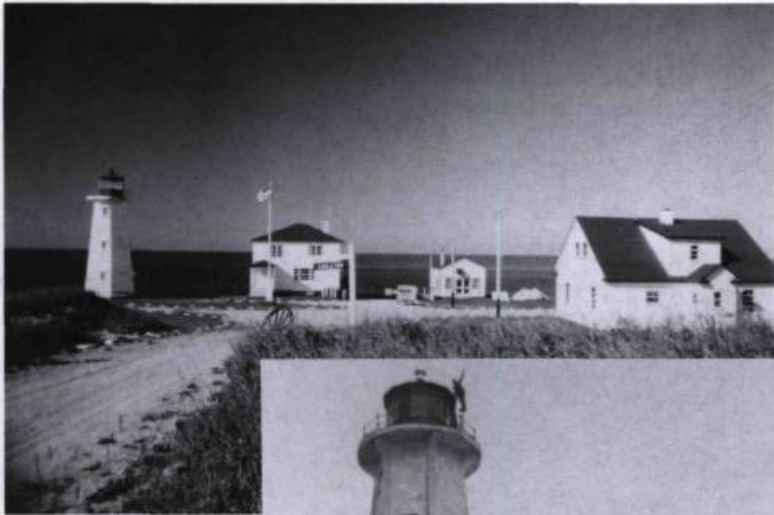
Anticosti, île du golfe Saint-Laurent qui possède plusieurs phares dont ceux de Carleton, Bagot Bluff... (Archives de l'auteur).