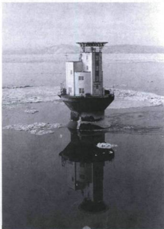
Phare-pilier de l'île Blanche en face de Rivière-du-Loup.

récits sur la vie au Labrador et des livres sur la chasse.