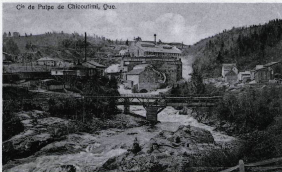
Carte postale de Novelty Manufacturing and Art Ltd de Montréal montrant le site de la Pulperie de Chicoutimi vers 1915. En avant-plan, le long de la rivière Chicoutimi, les trois moulins, le quatrième étant construit en 1919-1920. À gauche de la photo, le hangar à locomotive, le bureau administratif et l'atelier mécanique.