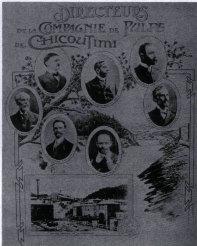
Les directeurs de la Compagnie de Pulperie de Chicoutimi.

candidats, l'équipe de Guay remporte cinq des sept sièges lors du scrutin qui se tient à l'époque à main levée. Aussitôt assermenté, Guay amorce la réalisation de son programme. Il engage le processus de modernisation des infrastructures de la ville en créant, coup sur coup, la Compagnie électrique de Chicoutimi et la Compagnie municipale des eaux de Chicoutimi; deux entreprises de capital-actions. Pour éviter la concurrence et assurer le fonctionnement des opérations, des privilèges d'exclusivité, d'une durée de 20 ans, vont être accordés à ces compagnies par les élus par voie de règlement.