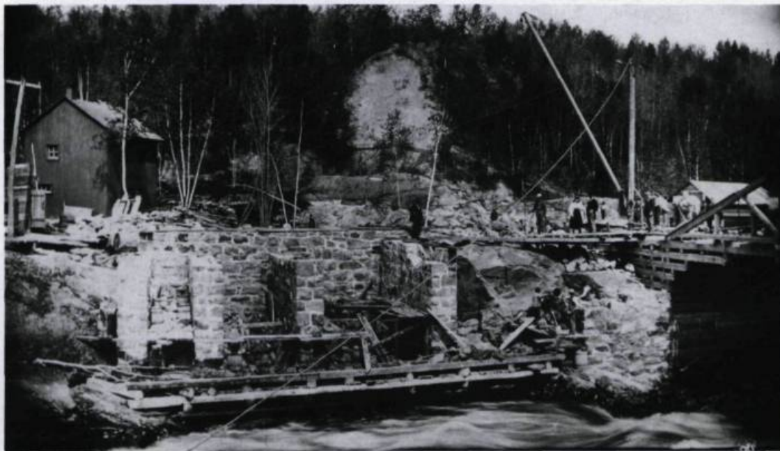
Le site de «l'île électrique» à Chicoutimi vers 1897. En avant-plan, la construction du premier moulin de la Pulperie de Chicoutimi. Œuvre de l'architecte C.E. Eaton et de l'ingénieur Alex Wender, son aménagement coûtera 125 000 $ et 75 employés seront affectés à la production. En arrière-plan, à gauche, la petite centrale de la Compagnie électrique de Chicoutimi.

C'est donc un vent d'inquiétude et de morosité qui affecte Chicoutimi à la fin du XIX e siècle. Dans ce contexte, la presse s'interroge sur la façon de ramener la confiance de la population, de susciter la concurrence et de favoriser de meilleures conditions salariales pour la classe ouvrière. La gestion des salaires est d'autant plus importante que le système de rémunération adopté par la Price — les fameux «pitons» — a toujours cours à Chicoutimi, en dépit des pressions ouvrières.