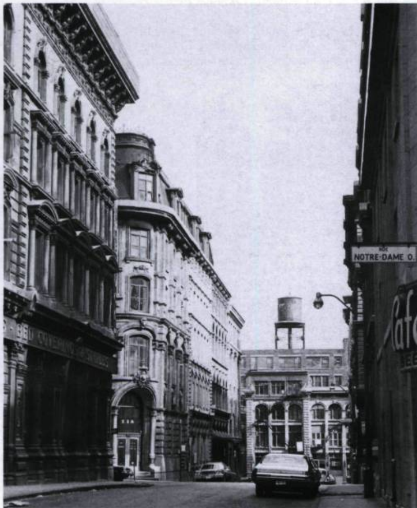
Le Vieux-Montréal, un centre-ville de la période industrielle: la rue Sainte-Hélène.

Cette volonté de retrouver un Vieux-Montréal davantage de caractère vernaculaire, voire d'esprit français, est présente depuis le début et a été à l'origine de plusieurs propositions visant à recréer un environnement disparu. L'une d'entre elles a bien failli être réalisée. En effet, en 1976, le ministre des Affaires culturelles avait pris position en faveur du projet des sœurs grises, qui