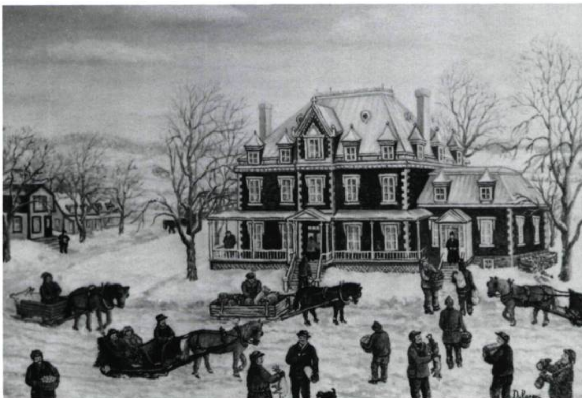
Le soir de la mi-carême, la nourriture recueillie par les quêteurs était déposée au presbytère pour les pauvres. Peinture de Dolorès Rodrigue.