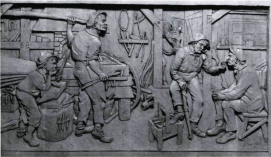
«La forge et les jaseux». Sculpture de Jean-Julien Bourgault, 1956.

chantait en latin la messe des morts. Finalement, on l'abandonna, mort de peur, dans la noirceur. Un autre de ces «malvas», dans une boutique de Saint-Séverin-de-Beauce, reçut plutôt la «punition du goudron»; on descendit ses pantalons, et après l'avoir assis dans une cuvette de goudron tiède, on les lui remonta.