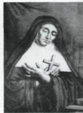
Marie de l'Incarnation (1599-1672), ursuline et auteure de près de 13 000 lettres est un témoin privilégié de l'œuvre de François de Laval.