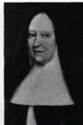
Jeanne-Françoise Juchereau de La Ferté, dite mère de Saint-Ignace, première supérieure de l'Hôtel-Dieu et rédactrice des Annales de l'institution de 1636 à 1716. (Attribué à Jean Guyon. Archives du Monastère des augustines de l'Hôtel-Dieu de Québec).