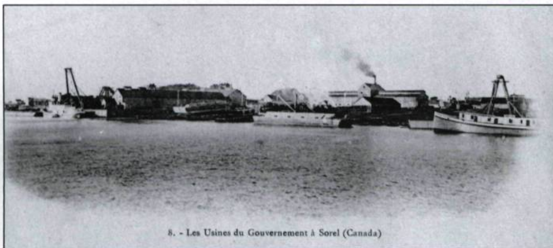
8. - Les Usines du Gouvernement à Sorel (Canada)

Cette industrialisation de la deuxième moitié du XIX e siècle a un important impact sur l'aspect de Sorel. Sa population double durant cette période, ce qui entraîne un nouveau découpage