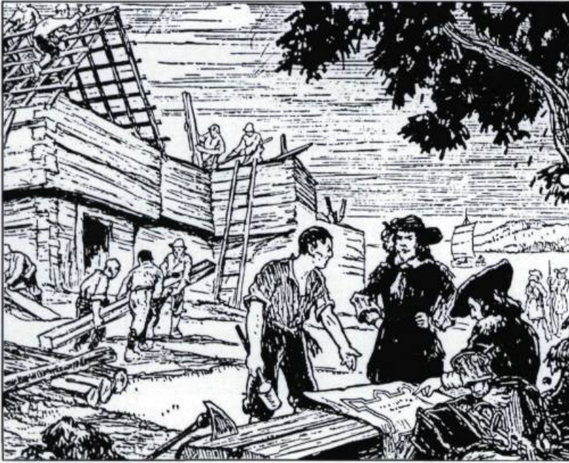
Charles Huault de Montmagny, deuxième gouverneur du Canada, fait ériger, en août 1642, le fort Richelieu. (Dessin tiré du Programme souvenir des fêtes du troisième centenaire de Sorel. Collection de l'auteur).

Huault de Montmagny, deuxième gouverneur de la Nouvelle-France, a comme premier souci d'assurer la sécurité des quelques centaines de colons, dispersés le long du fleuve Saint-Laurent, contre les incessantes attaques iroquoises.