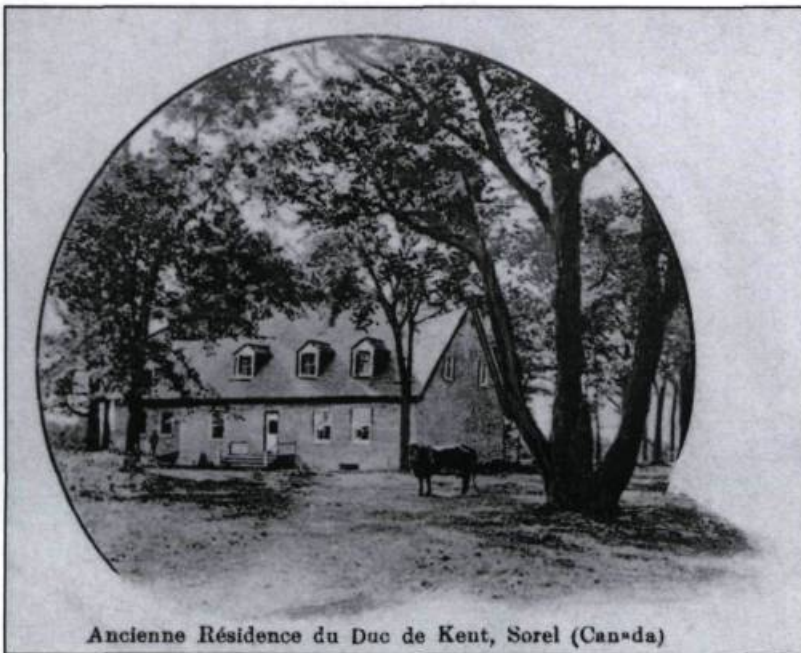
Ancienne Résidence du Duc de Kent, Sorel (Canada)

Peu après, en novembre 1775, le général américain Easton déloge la garnison anglaise de Saurel. Le 31 décembre, le général Montgomery attaque Québec mais il meurt en escaladant la citadelle. Le désarroi s'empare de ses troupes qui se replient sur Saurel, où le général Sullivan établit un camp afin de surveiller les mouvements de l'armée anglaise. Le 8 juin 1776, le général anglais Bourgoyne disperse un corps de 18 000 rebelles américains près de Trois-Rivières et s'avance jusqu'à Saurel où le général Sullivan, déconcerté, quitte son campement. Le général Bourgoyne le poursuit jusqu'à Saratoga où la victoire, remportée par les rebelles, le 16 octobre 1777, met fin à cette guerre anglo-américaine qui se conclut par la proclamation de l'indépendance des États-Unis d'Amérique.