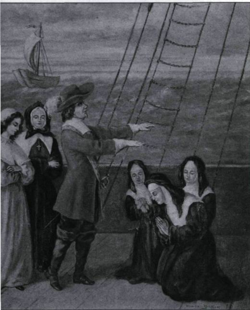
Jérôme Le Royer de La Dauversière (1597-1659) bénissant les trois hospitalières de Saint-Joseph à leur départ de La Rochelle pour Montréal.

En ces temps de découvertes, «il n'y en a point de plus abandonnés de secours spirituels que les Sauvages de la Nouvelle France. Et pour les guérir Dieu a envoyé les Français pénétrer avant dans leurs terres, et fait cognoistre de jour en jour qu'il a agréable la dévotion des âmes qui y