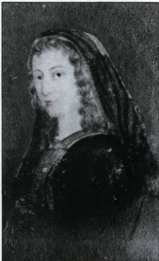
Jeanne Mance, née à Nogent-en-Bossigny, Champagne (1606-1673). Arrivée en même temps que Maisonneuve, en 1642 à Ville-Marie, elle y fonde, deux ans plus tard, l'Hôtel-Dieu.

Les Véritables Motifs , qui supportent les débuts de ce Montréal que nous connaissons aujourd'hui, sont sans doute d'inspiration plus sécularisée! Mais n'oublions pas que Montréal a d'abord été fondée pour des motifs religieux. Ces fondateurs n'étaient pas des fanatiques ni des illuminés. Par exemple, ils ne pensaient pas du tout occuper le territoire des autochtones; à Montréal comme en Europe, une terre non habitée appartient au premier occupant; et ils ont trouvé un Montréal désert même si des Iroquois y ont autrefois demeuré (2) . Leur rêve de fraternité par le travail agricole, l'éducation, le mariage entre Amérindiens et Français se teinte sans doute de paternalisme, mais il est marqué d'une générosité intelligente. ♦