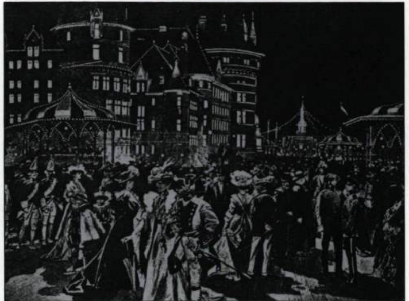
Le 30 septembre 1885, le lieutenant-gouverneur Louis-François Rodrick Masson inaugure la première illumination électrique de la terrasse Dufferin à Québec. En 1908, pour les fêtes du tricentenaire les autorités municipales utilisent abondamment l'électricité pour les célébrations de nuit. (Dessin de F. de Halnen. The Quebec Tercentenary Commemorative History. Québec, The Quebec Daily Telegraph Printing House, 1908. p. 75).

l'âtre s'avère, à en croire Marguerite Bourgeois, d'une efficacité douteuse: «C'eût été un grand excès, écrit-elle en 1644, de s'éloigner de la cheminée seulement une heure, car malgré les flambées, la pièce était une glacière; encore fallait-il avoir les mains cachées et être bien couverte». Après 1750, le foyer ouvert cède le pas au poêle à bois, d'une efficacité énergétique et calorifique bien supérieure.