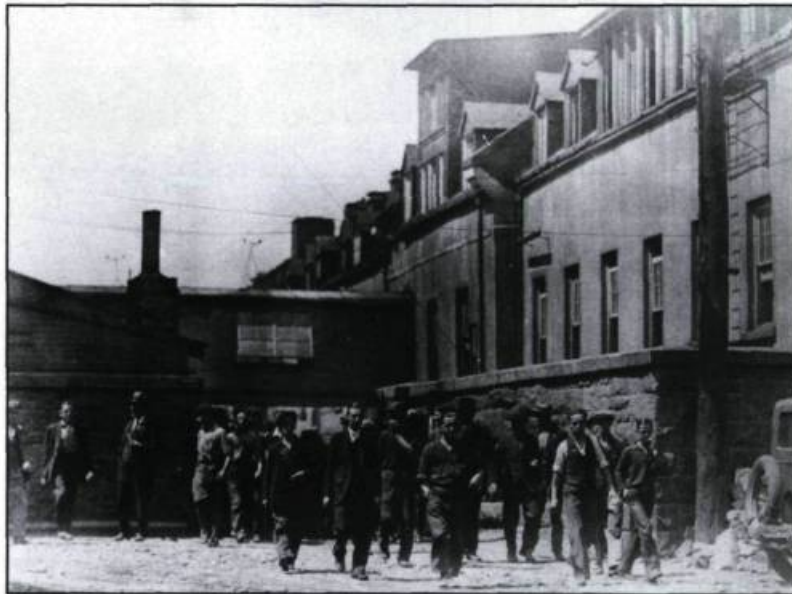
La sortie des ouvriers de la cartoucherie vers la côte du Palais en 1941.

abondante et docile, disposée à travailler fort pour assurer sa subsistance.