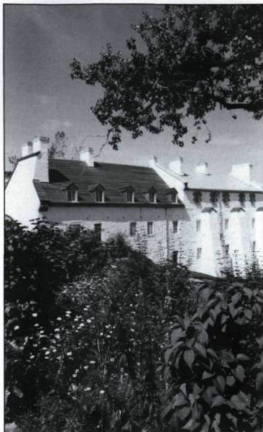
De 1880 à 1958, la redoute Dauphine abritait la résidence du surintendant de l' Arsenal de Québec.

que complexe industriel. Le surintendant de l' Arsenal habite même au cœur des installations industrielles du Vieux-Québec, dans les anciennes casernes Dauphines, construites par les soldats français au XVIII e siècle.