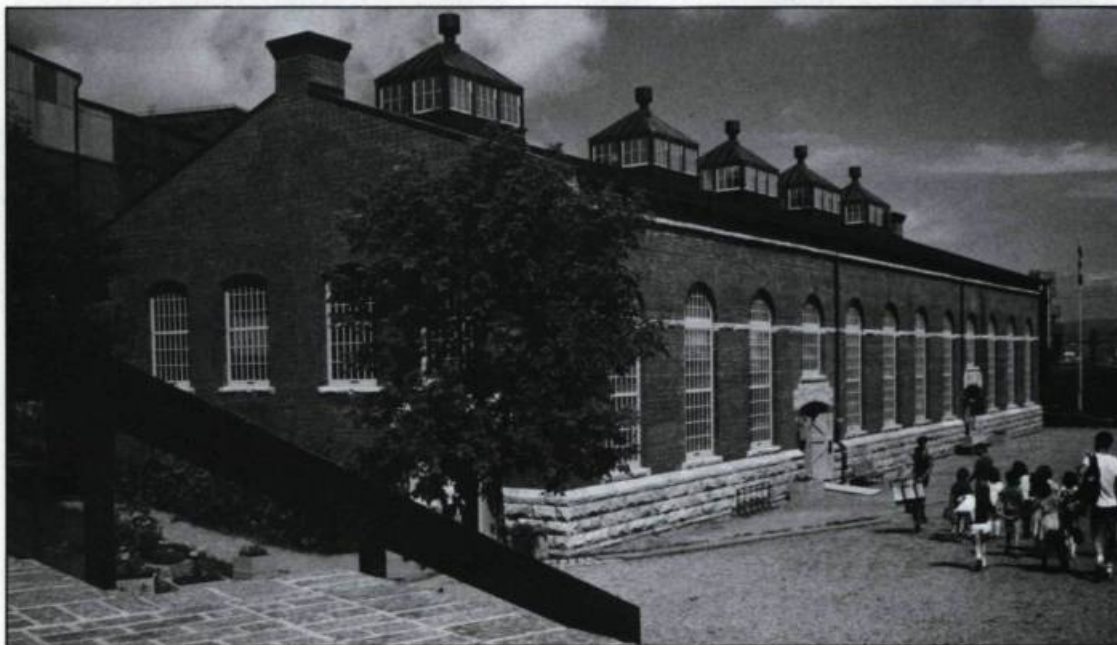
L'ancienne fonderie aujourd'hui transformée en Centre d'interprétation du parc de l'Artillerie.

érige près de la citadelle, à un endroit appelé «Cove Field», des baraquements palissadés où s'effectue le chargement des cartouches par les ouvrières de l'Arsenal. Au début du siècle, on construit une fonderie et un atelier mécanique dans le secteur de l'Artillerie. À l'approche du second conflit mondial, le programme de réarmement général nécessite la construction de nouvelles installations à Val-Rose (Valcartier). Au plus fort du conflit, le gouvernement utilise les usines désaffectées du Canadien National dans le quartier Saint-Malo. L'Arsenal possède aussi des installations près du port de Québec. L'entreprise possède des usines réparties aux quatre coins de la ville. Le secteur de l'Artillerie reste toutefois le centre nerveux de ce gigantes-