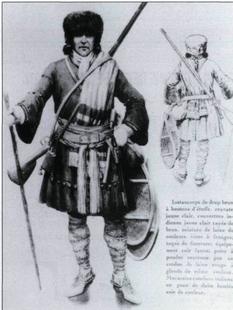
Justaucorps de drap brun à boutons d'étoffe; cravate jaune clair; couverture indienne jaune clair rayée de brun; ceinture de laine de couleur vive à franges; toque de fourrure; équipement cuir fauve; poire à poudre soutenue par un cordon de laine rouge à glands de même couleur. Mocassins (souliers indiens) en peau de daim brodée soie de couleur.

Règle générale, une compagnie se compose d'un capitaine, d'un lieutenant, d'un enseigne, de quelques sous-officiers comme des sergents et de 50 soldats. Afin d'inciter les capitaines à faire du recrutement, le roi leur promet de payer rétroactivement au mois de janvier 1665 la solde de tous les soldats engagés.