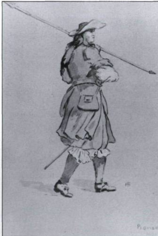
Ces aquarelles de Henri Beau montrent un piquier et un grenadier du Régiment de Carignan-Salières en 1665. (Archives nationales du Québec à Québec, collection initiale).

À l'automne, Tracy organise une nouvelle expédition contre les Agniers. Le 14 septembre, il quitte Québec à la tête de 400 volontaires auxquels se joignent près de 1 000 soldats en cours de route. Fort de 1 400 hommes, Tracy atteint le lac Champlain à la fin de septembre.