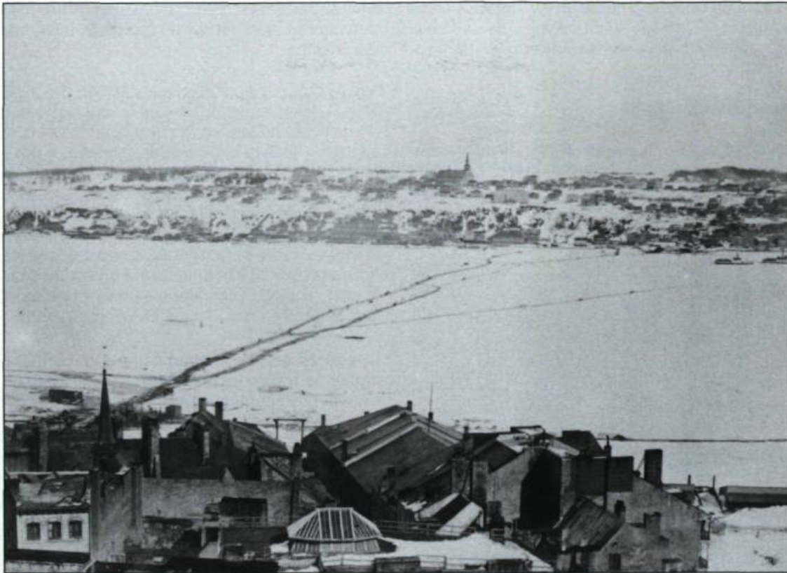
St. Lawrence Ice Bridge and Town of Lévis.

même que des volailles. Les victuailles arrivent alors en une telle abondance que les consommateurs bénéficient ordinairement d'une diminution des prix. Cette économie est due à l'utilisation gratuite du pont de glace, alors que la traverse estivale nécessite un déboursé de la part des agriculteurs. En plus de permettre un meilleur approvisionnement, les ponts de glace facilitent le transport des marchandises lourdes telles que le bois de chauffage et la pierre.