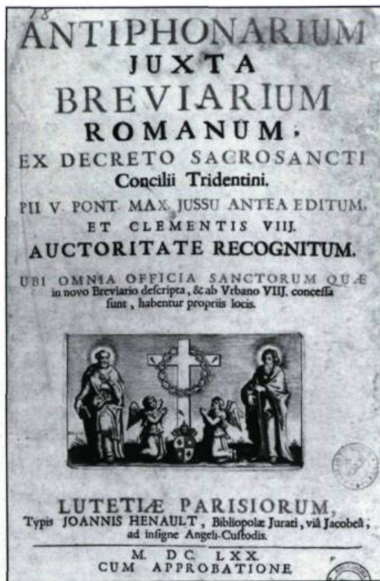
Antiphonarium (1670). (Archives et livres rares, université Laval).

Après l'incendie du premier monastère, le 30 décembre 1650, les Ursulines reprennent cou-