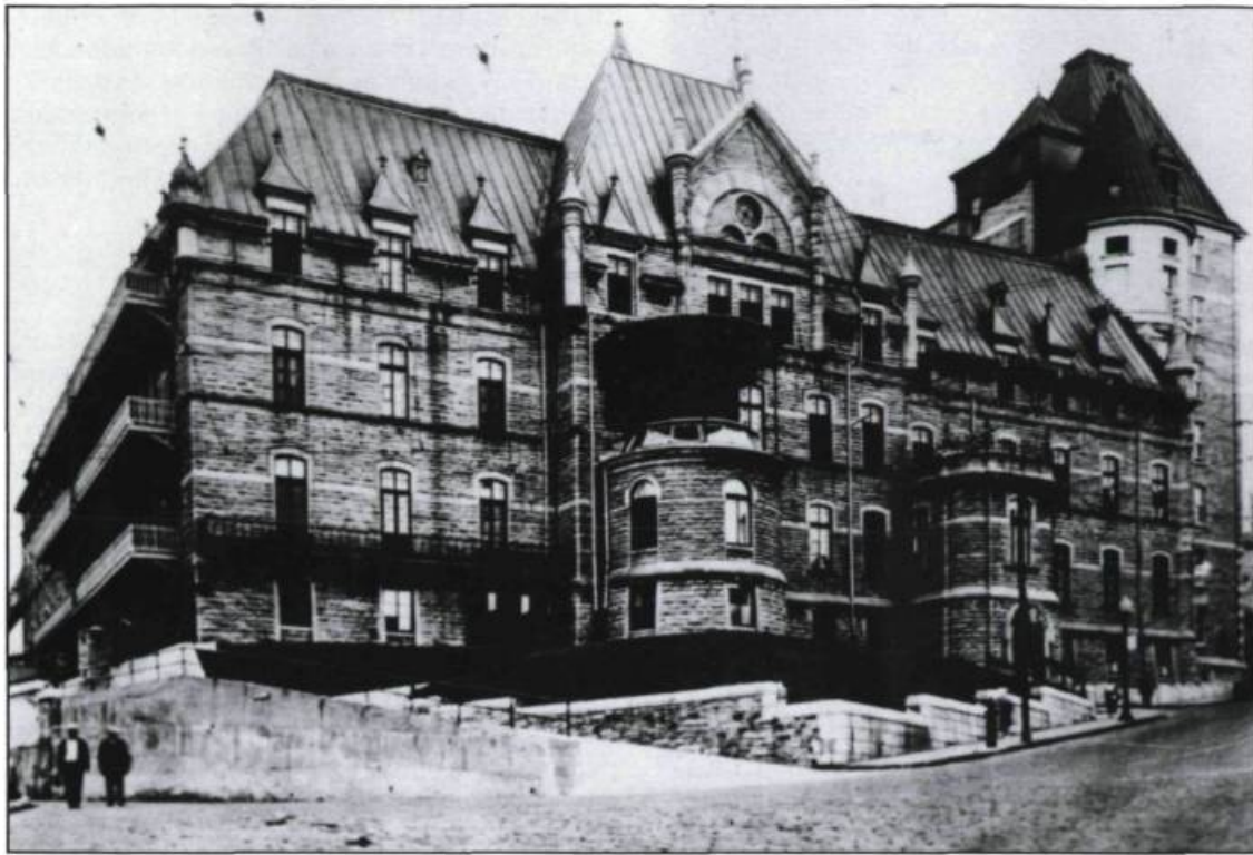
Ancienne porte du dispensaire du pavillon d'Aiguillon donnant sur la côte du Palais. (Photographie médicale, Hôtel-Dieu de Québec).