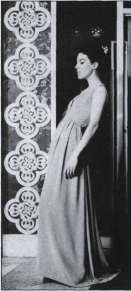
Robe de grand soir en crêpe de soie gris souris. Collection haute couture printemps-été 1963. (Michel Robichaud Inc. Studio, Montréal).