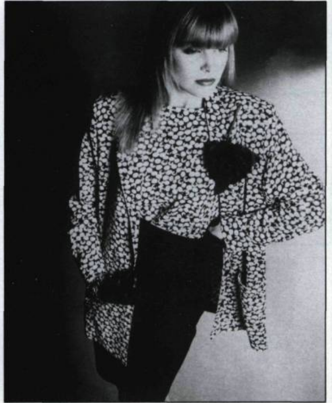
Collection printemps-été 1988 de Robichaud diffusion. Ensemble de ville trois pièces, marine et blanc. Bijoux, ceinture et bas signés également Michel Robichaud. (Collection Michel Robichaud).

CAD – Pour finir, monsieur Robichaud, quelle place tient l'histoire dans votre vie?