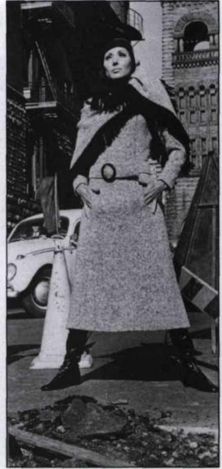
Robe manteau en tweed noir et blanc, avec grand châle frangé noir. Chapeau en cuir vernis noir. Collection prêt-à-porter automne-hiver 1969.

occasions, alors que moi j'innovais en faisant des vêtements de jour, des tailleurs et des manteaux principalement, car c'est ce que je préférais faire. Je considérais que c'était plus important et plus logique de mettre de l'argent sur des vêtements que l'on porterait souvent, plutôt que sur une robe du soir que l'on porterait occasionnellement. C'est ce qui a fait mon succès, les gens ont commencé à reconnaître mes vêtements très dépouillés mais parfaitement coupés, différents de la tendance générale au Québec. C'est la presse qui a tout de suite déclaré que mon style s'approchait de ce qui se faisait de mieux en Europe.