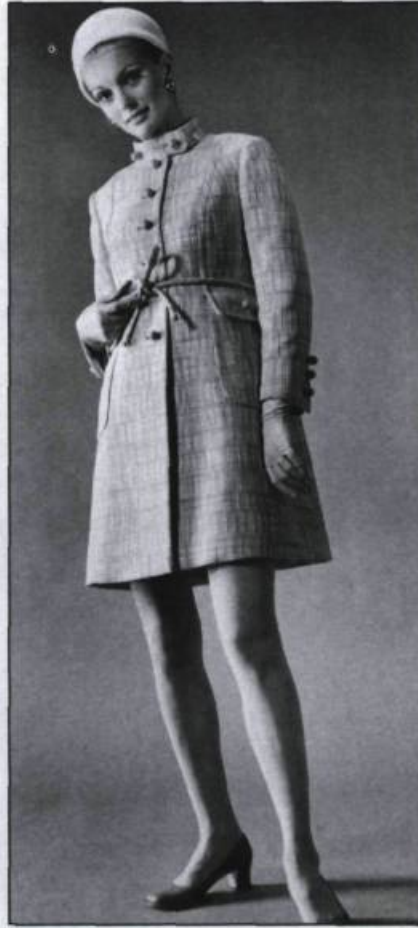
Été 1967.