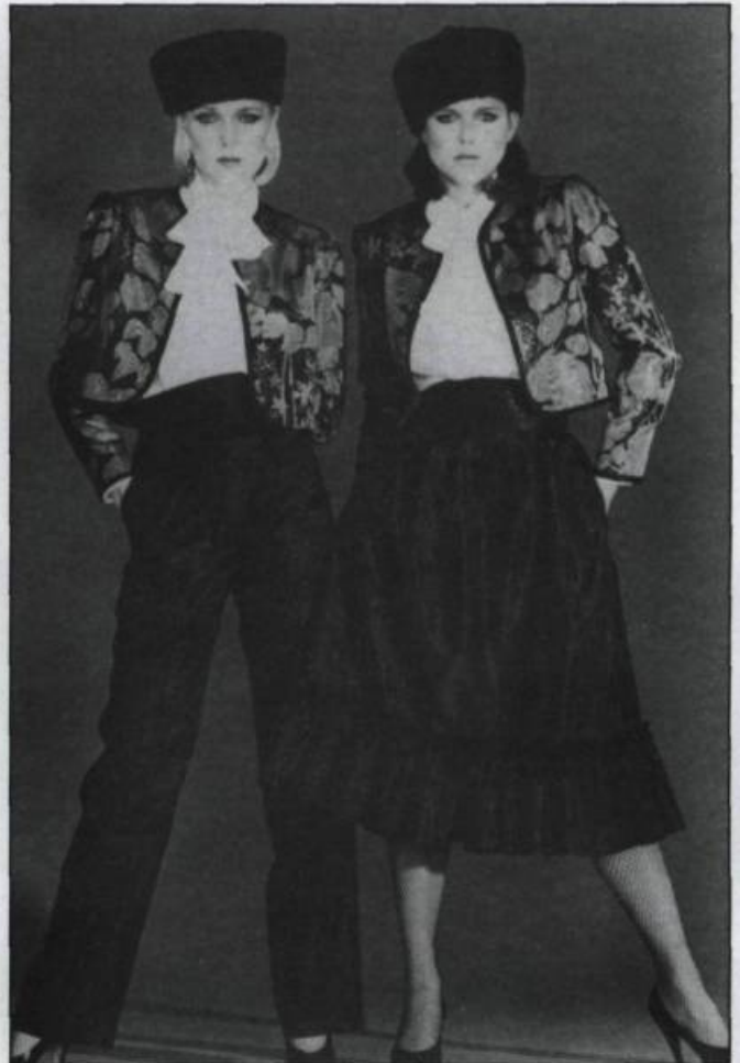
Boléro en rouge ou noir en faille imprimé avec jupe ou pantalon en faille noir et blouse en crêpe blanc. Automne-hiver 1981. (Collection Michel Robichaud).