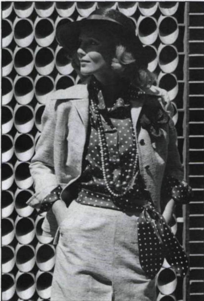
Printemps-été 1974. (Collection Michel Robichaud).