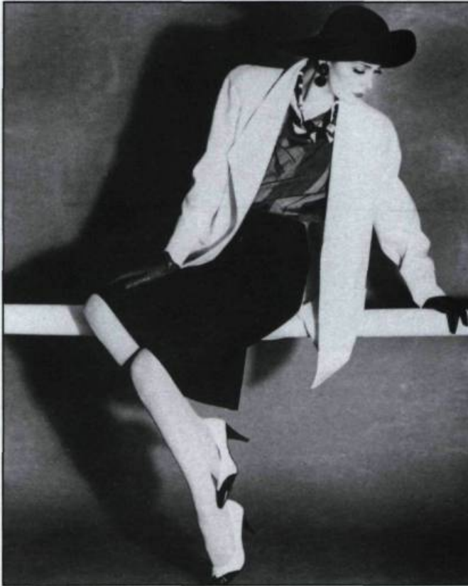
Collection printemps-été 1984.

CAD – La fourrure ne permet-elle pas d'atteindre les marchés européens et américains?