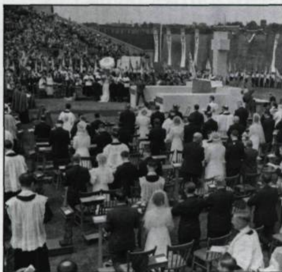
En 1939, la jeunesse ouvrière catholique organise à Montréal une cérémonie de 105 mariages collectifs..

Dans le milieu de la confection, on qualifie cette période un peu nostalgiquement, d'époque des beaux mariages. Les journaux de fin de semaine consacrent une rubrique importante au mariage décrivant, photos à l'appui, les toilettes arborées pour l'occasion. Ils constituent une source privilégiée de renseignements sur la mode, les usages et les coutumes de l'époque.