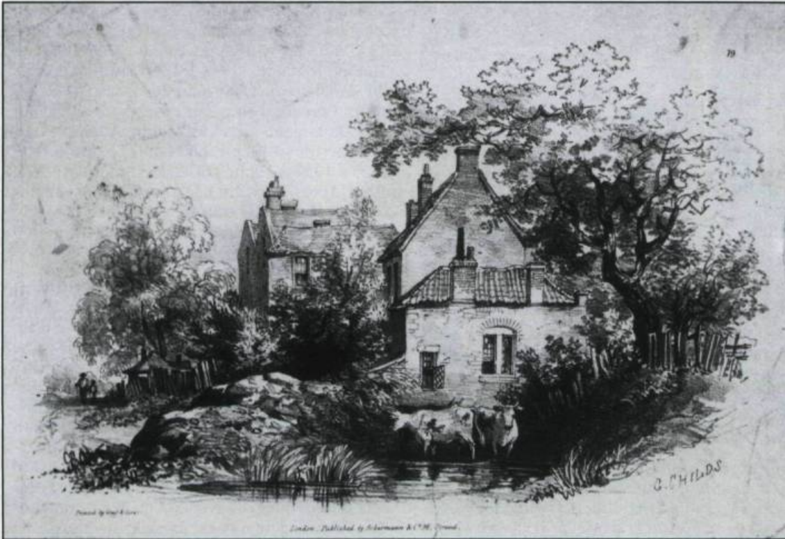
Exemple d'un paysage tiré du cartable des professeurs de dessin du Séminaire de Québec. Dessin de G. Childs, Angleterre, XIX ème siècle. (Archives du Séminaire de Québec).