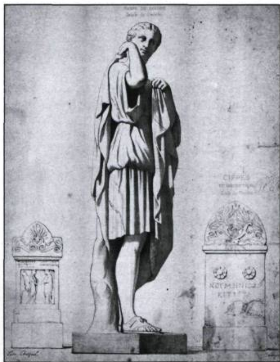
Lithographie de Cam. Chazal représentant Diane dite de Gabies. France, XIX ème siècle.