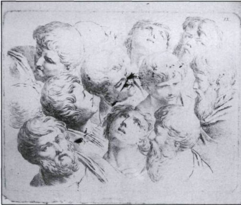
Étude de têtes. Celles-ci servaient de modèle aux étudiants qui pouvaient ainsi recréer divers types d'émotions: le calme, la tristesse, l'étonnement. (Archives du Séminaire de Québec).

En effet, en quadrillant la gravure, l'on pouvait reporter le motif carré par carré sur un autre support, et ainsi reproduire fidèlement le modèle désiré. Ce procédé était courant au XIX ème siècle, non seulement comme moyen éventuel d'apprentissage par des étudiants, mais également par les artistes de l'époque qui se servaient de modèles gravés pour réaliser leurs tableaux.