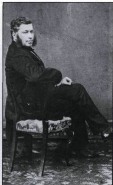
Deux illustres professeurs de dessin du Séminaire de Québec, les peintres Antoine Plamondon et Théophile Hamel.

mule privilégie le concept de «l'atelier libre» pour les élèves qui désirent suivre des cours spéciaux. D'abord optionnels, la direction du Séminaire encourage la tenue de cours lorsqu'un nombre suffisant d'élèves le justifie. Puis, le 13 octobre 1890, le Séminaire décide que les écoliers feront trois heures de dessin par semaine. Treize ans plus tard, le dessin devient obligatoire en cinquième. A partir de 1924, cet enseignement s'étend à la sixième et la septième. Au niveau universitaire, cette discipline entre officiellement au programme de la faculté des sciences en 1943.