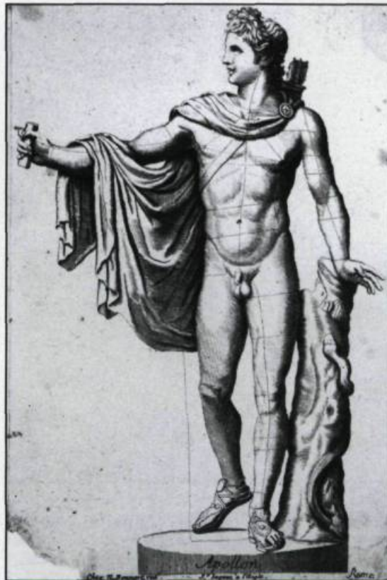
Le dieu Apollon, reconnu comme le symbole de la beauté, servait d'inspiration à l'enseignement du dessin. Eau-forte de Nicolas II Bonnart (?-1761). (Archives du Séminaire de Québec).

Viennent ensuite les modèles d'après les grands maîtres. Une imposante série du graveur De Poilly prouve l'importance de ce type de gravures dans la formation artistique. De Poilly s'est surtout attardé aux études anatomiques d'après Anibal Carrache et Nicolas Poussin. Les études et les paysages sont aussi bien représentés dans ce cartable. Les études se subdivisent en trois grandes sections: les têtes d'expression, les détails anatomiques, l'académie.