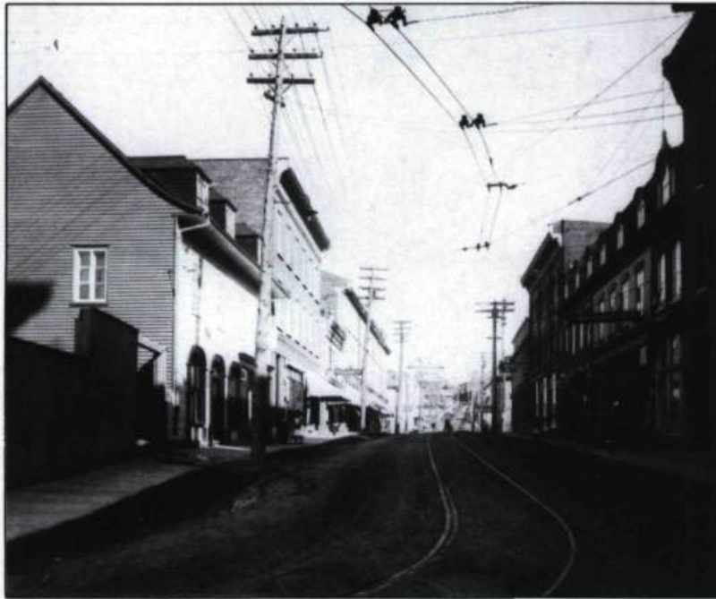
La Côte du passage au début du XXIème siècle. (Archives nationales du Québec).

Pour la plupart entreprises familiales et artisanales, ces scieries, fonderies, fabriques de limes, chaussures, instruments aratoires, articles de toutes sortes deviennent florissantes. La compagnie Carrier & Lainé, entre autres, s'impose comme le plus important atelier de construction mécanique du Canada. À la fin du XIXième siècle, cette industrie, située près de la traverse, emploie jusqu'à 600 personnes.