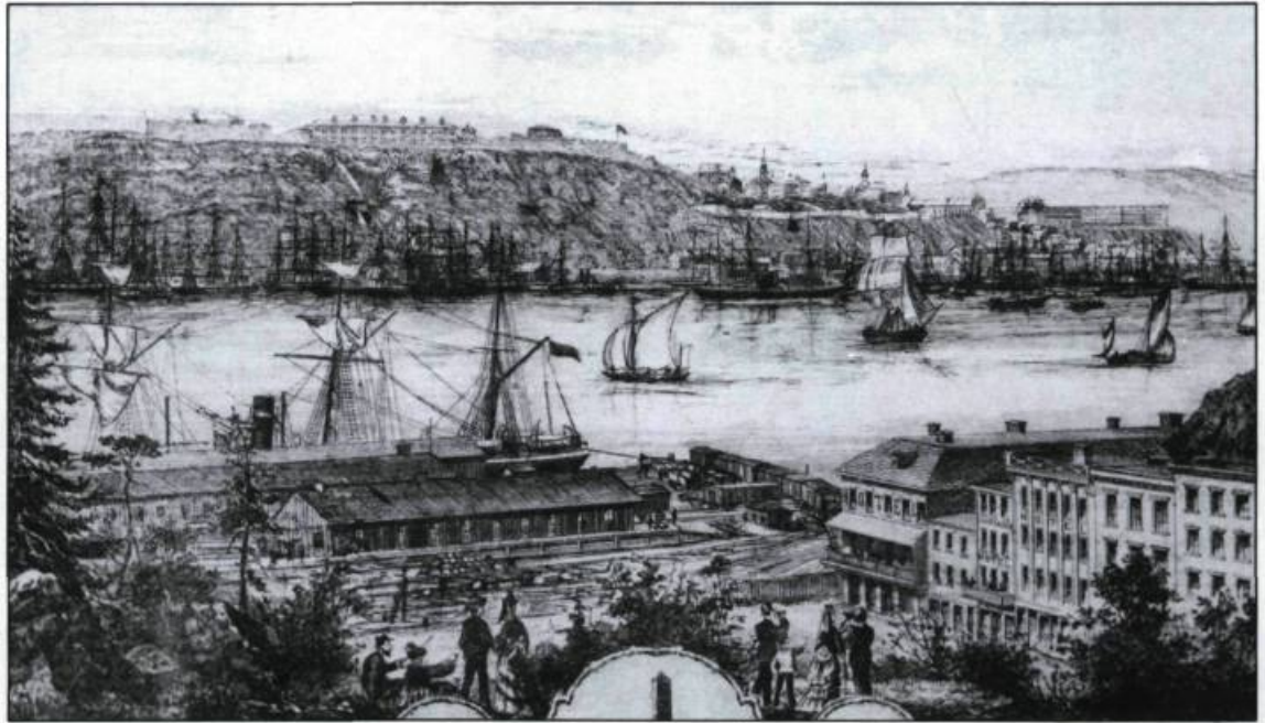
La gare du Grand Tronc à Lévis, vers 1865. (Archives nationales du Québec).