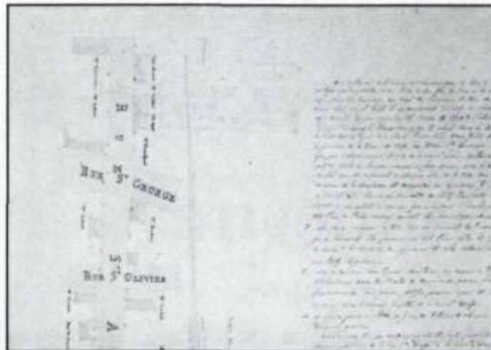
Extrait de la carte de 1829 de l'arpenteur Jean-Baptiste Larue montrant la maison Dubuc à l'angle des rues Saint-Georges (côte d'Abraham) et Saint-Augustin. Contrairement à la tradition, le propriétaire préfère une maison plus profonde que large afin de conserver sa façade sur la rue Saint-Georges.

Aujourd'hui il nous reste donc des textes qui nous renseignent sur des cas particuliers. Il faut donc reconstituer l'image formelle de ce modèle qui allait de soi, pour comprendre ces textes et saisir les caractères généraux de l'architecture du faubourg avant 1845. De cette façon, la maison Dubuc devient possible à reconstruire et demeure toujours représentative du modèle architectural puisqu'il n'existe qu'un savoir-faire ou une seule maison qui soit implicite.