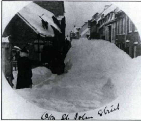
La rue Saint-Jean ensevelie sous la neige vers 1880. (Collection privée).

« habitat convenable », à transformer la trame des rues suivant le principe qui a présidé à la création du faubourg; recréer des rues piétonnes, fermer des sections d'artères, aménager les pentes abruptes avec des escaliers, réintroduire un mobilier urbain conforme à notre climat, à nos matériaux (pas d'importations de Boston ou de Hollande), et ceci en tenant compte de nos traditions architecturales et esthétiques; les bancs de neige font partie de notre patrimoine; les cours doivent retrouver leurs arbres, leurs jardins;