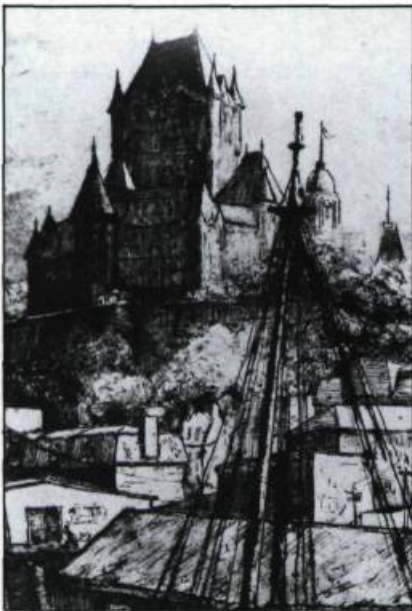
Les gravures contemporaines de Québec exploitent volontiers les sites plus touristiques de la Vieille Capitale. Simone Hudon, Le Château Frontenac à Québec, tiré de: Au fil des côtes de Québec, par Simone Hudon, 1967.

l'impressionnisme et le fauvisme. Cette jeune génération, loin de se plier inconditionnellement aux nouvelles tendances artistiques, adaptera les principes de cet enseignement à une production canadienne fortement figurative et davantage conservatrice. Le Québec des Pilot, Cullen et Morrice, révélera l'apport européen et perdra de sa saveur documentaire, pittoresque ou exotique. Dès lors, les monuments, les marchés, les édifices seront le lieu et le motif où les jeux de lumière, les contrastes de formes et de couleurs viennent concurrencer l'objectif premier qu'est la mise en valeur du site. Le fossé se creuse peu à peu entre le motif privilégié par l'artiste et le mode d'expression.