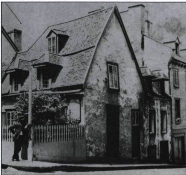
La maison Jacquet, sise rue Saint-Louis.

C'est cette ville classique, déjà connue et fréquentée en raison de ses monuments, que l'ère industrielle va considérablement modifier. Mais alors que partout dans la province, et surtout à Montréal, c'est l'architecture dite «victorienne» qui