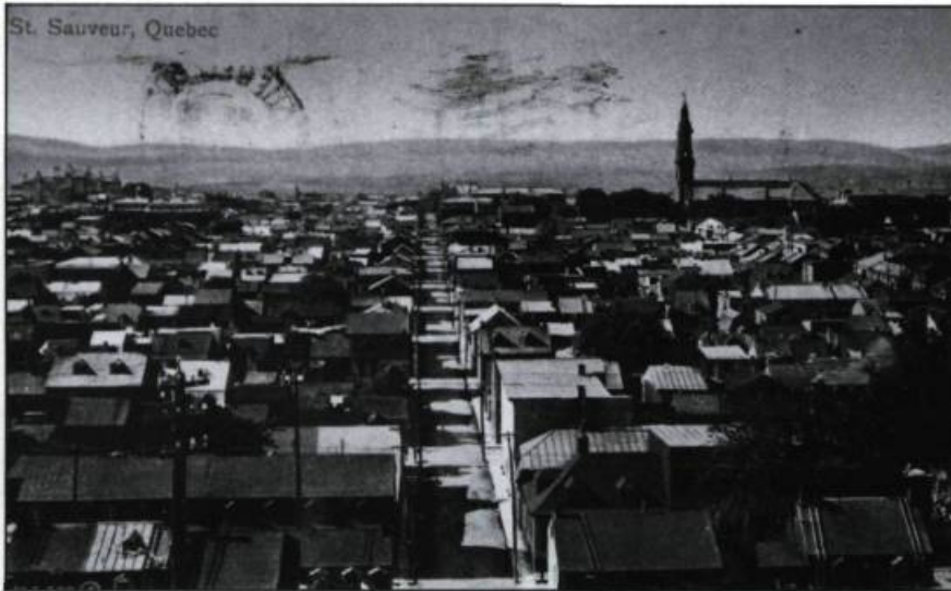
Vue du quartier Saint-Sauveur en basse-ville de Québec, vers 1911. Carte postale. (Coll. Yves Beauregard).

deux premiers baisers à des adolescentes de jadis.