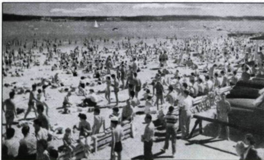
Plage de l'Anse-au-Foulon, Québec, s.d. Carte postale.

C'est étrange! Par deux fois j'ai exécuté un grand saut pour mâter les deux falaises: celle qui donne sur l'Anse-au-Foulon et l'autre qui domine le quartier Saint-Sauveur. Chaque fois j'ai failli y laisser ma vie, comme si j'avais défié un monstre invisible. En 1934, faisant tourner mon maillot de bain au bout du poing, je m'étais arrêté dans la Côte Gilmour, près du sommet, d'où je contemplais la plage de l'Anse-au-Foulon, grouillante de baigneurs venus de tous les quartiers de Québec. Soudain un grand cri de femme épouvantée me fait sursauter, assez pour apercevoir du coin de l'oeil une énorme masse noire qui fonçait dans mon dos. Je fus catapulté dans le vide par le petit pare-choc arrière droit d'une vieille Pierce Arrow dont l'embrayage s'était bloqué au neutre au sommet de la côte. Mais les freins avaient aussi flanché, d'où sa descente à reculons vers moi. J'atterris cinquante pieds plus bas dans le tuf de la falaise où la Pierce Arrow m'a suivi, me frôlant de très près. Miraculeusement indemne je me rendis à la plage où mes amis m'accueillirent comme le Pégase de Québec. J'y fus pris en main par un personnage légendaire qui y avait monté sa tente: on l'appelait Six-Fois-Turcotte parce qu'il courait sans cesse et qu'il prétendait avoir fait six fois le tour de la ville, sans arrêt, au trot. Six-Fois-Turcotte me fit coucher dans le sable, baissa mon pantalon et se mit à me frotter le coccyx avec de l'alcool à friction, pendant qu'un chapelet de