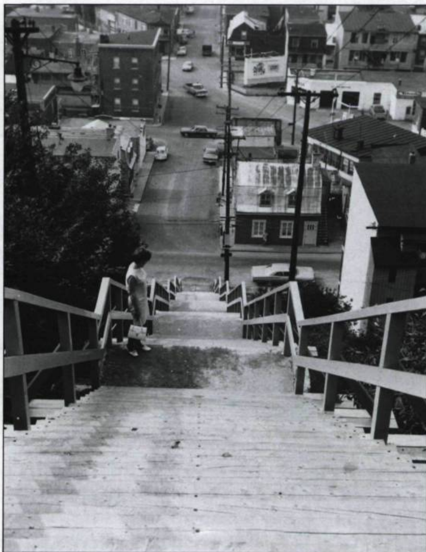
Escalier menant de la rue de l'Alverne à la rue Arago, 1967.

Sur l'autre versant, à Saint-Sauveur, en 1936, j'ai fait un saut en skis à partir de la rue de l'Alverne utilisée comme tremplin. Dans les airs, poussé par un coup de nordet, j'ai longé l'escalier et je me suis assommé sur une maison de la rue Arago. Cela m'a coûté sept ans de chaise roulante. Et la lumière m'aveugla comme Saint-Paul sur le Chemin de Damas! Je comprenais enfin! Ce n'étaient pas des plongeurs vers le bas