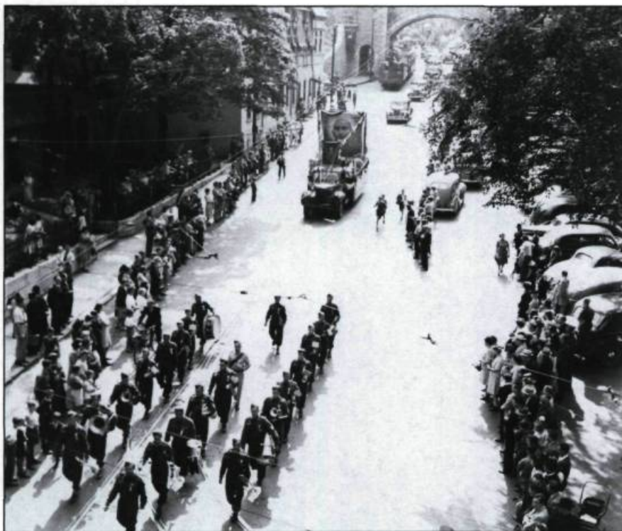
Parade chinoise accompagnée de chars allégoriques dans la rue Saint-Louis, 1945.

que je devais exécuter, mais des bonds vers les étoiles. Je ne voyais qu'un seul moyen d'y arriver tout en restant bien en vie: la littérature.