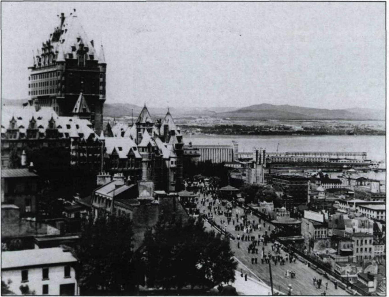
Le Château Frontenac, la Terrasse Dufferin et la basse-ville. Canadian Pacific Airlines, vers 1940. (Archives de la ville de Québec).