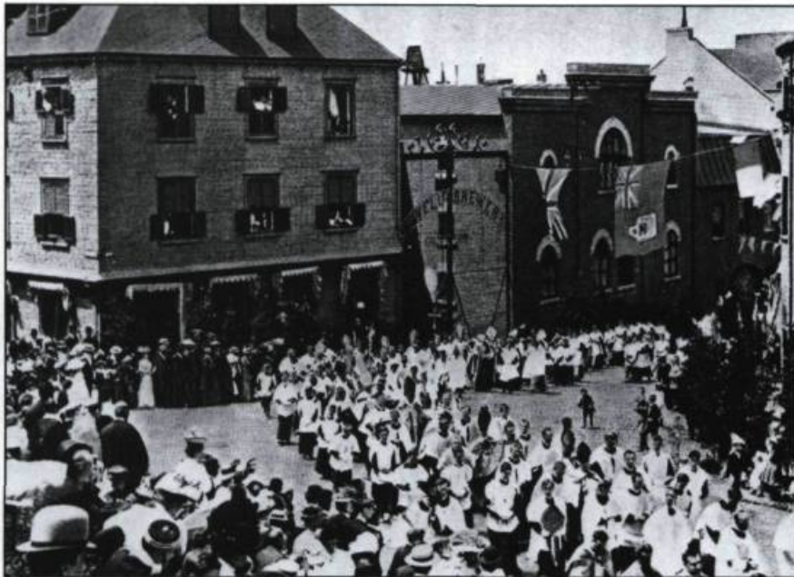
Ilot Saint-Nicolas ou des Bains. La procession de la Fête-Dieu quitte la rue Saint-Nicolas pour s'engager dans la Côte du Palais, angle Saint-Vallier. Carte postale, vers 1905.

Fabrique et la rue Buade pour aboutir à la ruelle du Trésor. Elle est ainsi désignée parce qu'autrefois, elle conduisait à la Trésorerie ou