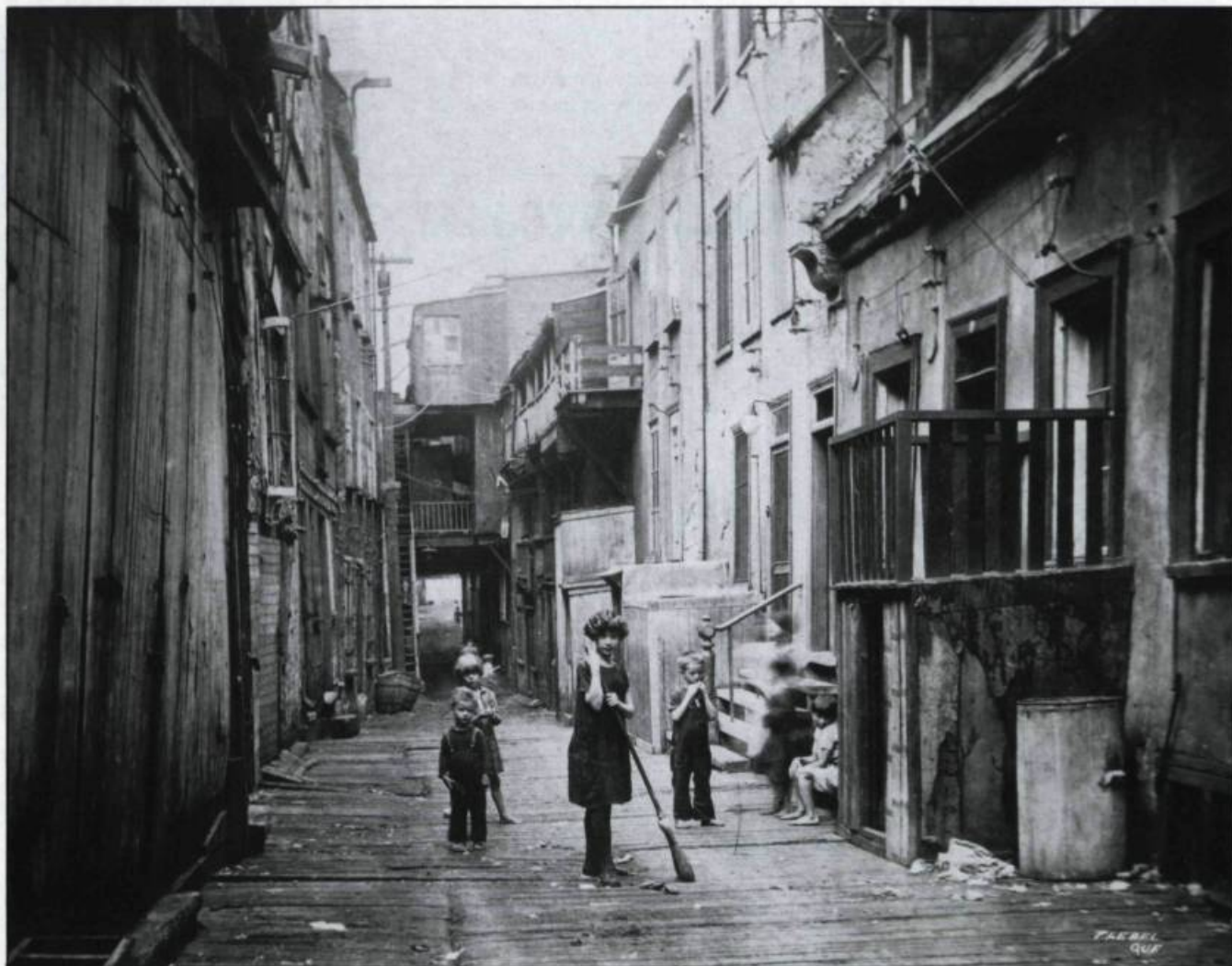
Jeunes enfants dans la rue Sous-le-Cap. Cliché pris au cours des années vingt.

Que dire de la rue des Bains dans une ville bien loin de la Floride! Ce nom n'a rien à voir avec le climat mais évoque plutôt les premiers bains publics installés à Québec en 1817. Reprenant notre promenade, nous remontons la Côte du Palais, empruntons la rue Saint-Jean, la Côte de la