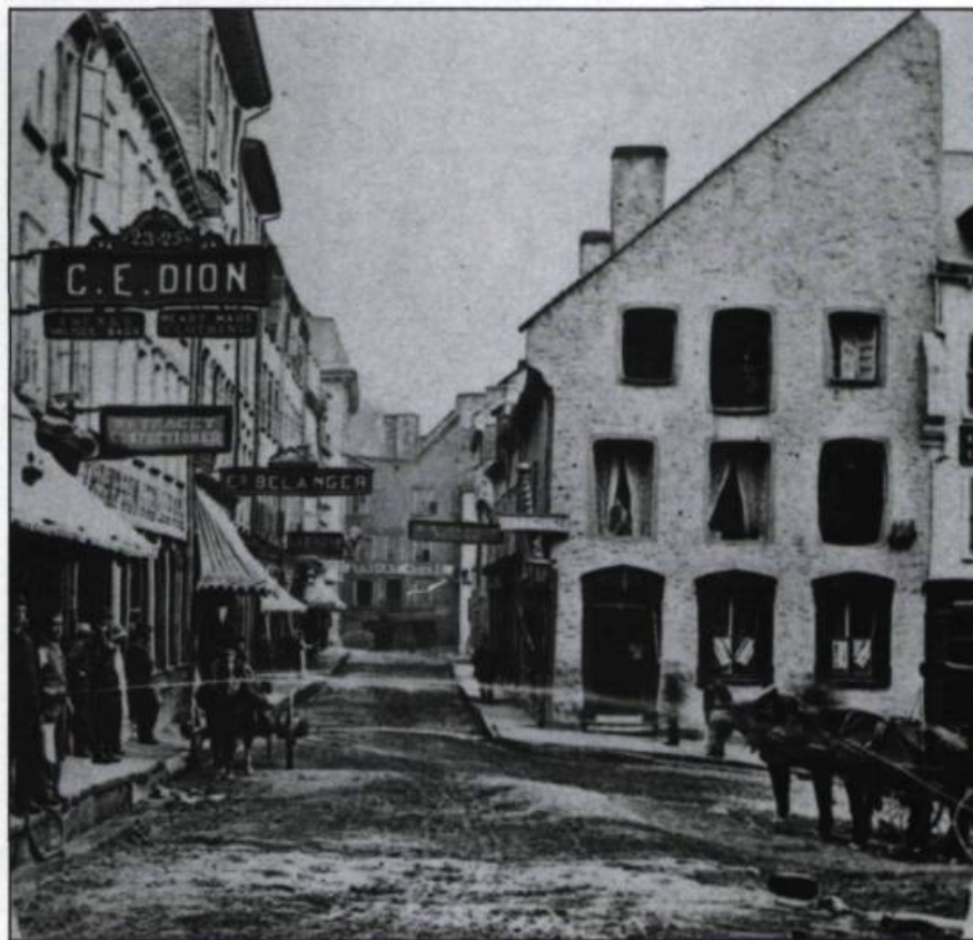
Photographie de la rue Notre-Dame en basse-ville vers 1865. Demi-stéréogramme.

On établit généralement à une quarantaine le nombre de rues tracées et