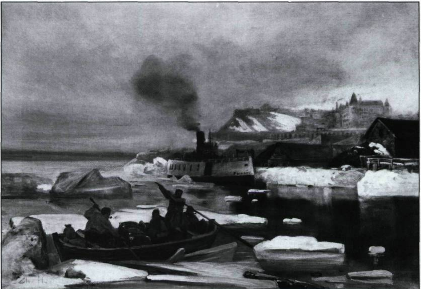
Ce site, déjà fort exploité depuis le XVIII ème siècle, démontre les changements stylistiques de la production typiquement canadienne. On y sent l'influence du mouvement académiste français. Charles Huot, Québec vue du bassin Louise, s.d..

En littérature à la même époque, les récits de voyages du Nouveau