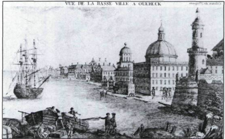
Cette représentation de Québec n'a de réel que le titre. Elle démontre à quel point cette imagerie fut tributaire de l'imagination ou encore de l'absence d'informations précises des artistes, qui illustraient parfois la ville sans jamais y avoir mis les pieds. François-Xavier Habermann, Vue de la basse-ville à Québec, vers le fleuve Saint-Laurent . (Coll. privée).

À partir de la Conquête en 1759, l'arrivée de topographes de l'armée britannique modifiera quelque peu le mode de représentation et influencera l'évolution de l'imagerie. À l'académie militaire de Woolwich en Angleterre, les officiers de l'artillerie ou du génie reçoivent une formation poussée en dessin et en art du paysage. Les professeurs y enseignent, à des fins strictement militaires, la technique de l'aquarelle qui permet