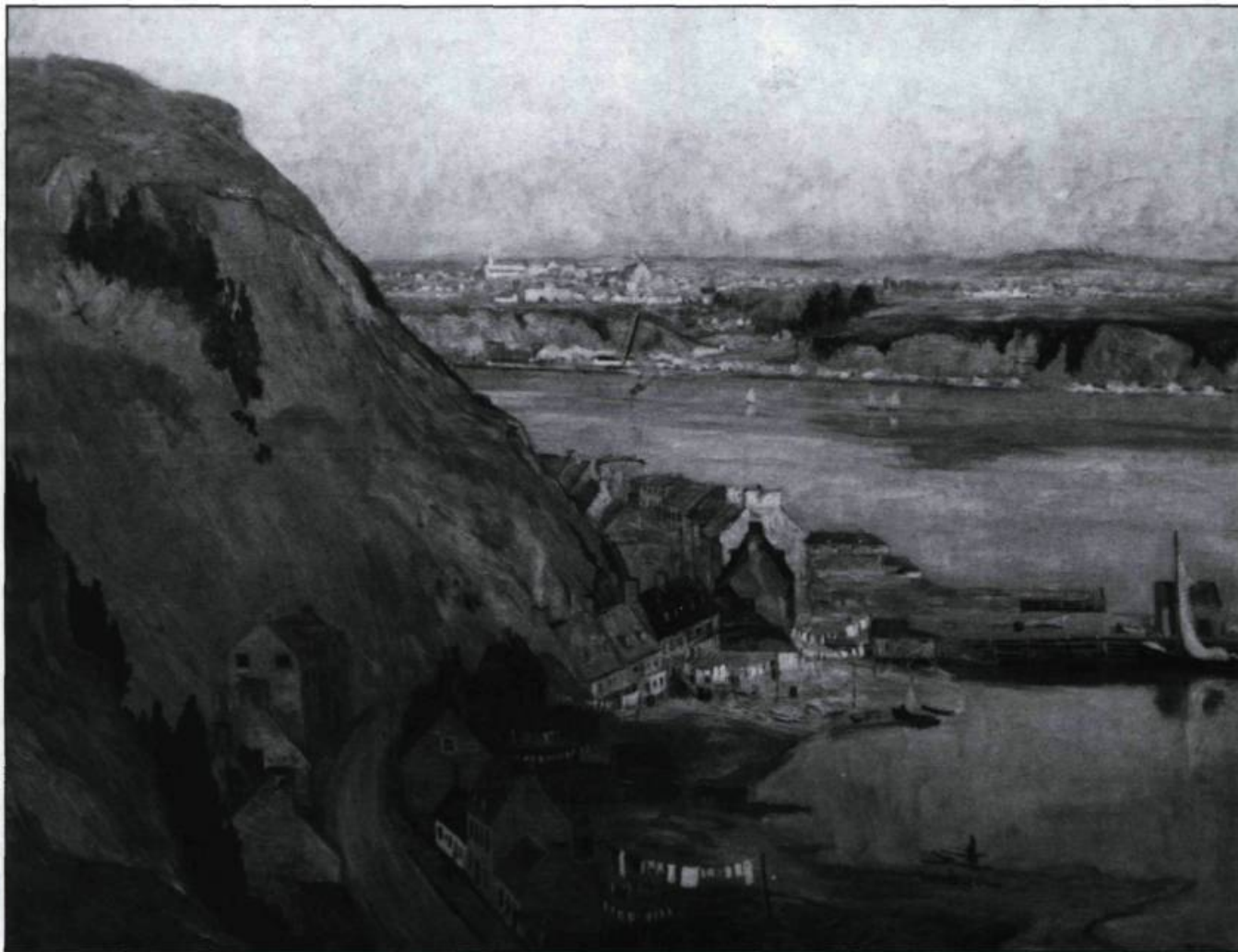
Au cours de la seconde moitié du XIX ème siècle, les sites favoris des artistes changent. Ils privilégient des endroits moins touristiques et la recherche picturale empiète sur la valeur patrimoniale et historique du sujet. Maurice Cullen, l'Anse des mères , 1904.