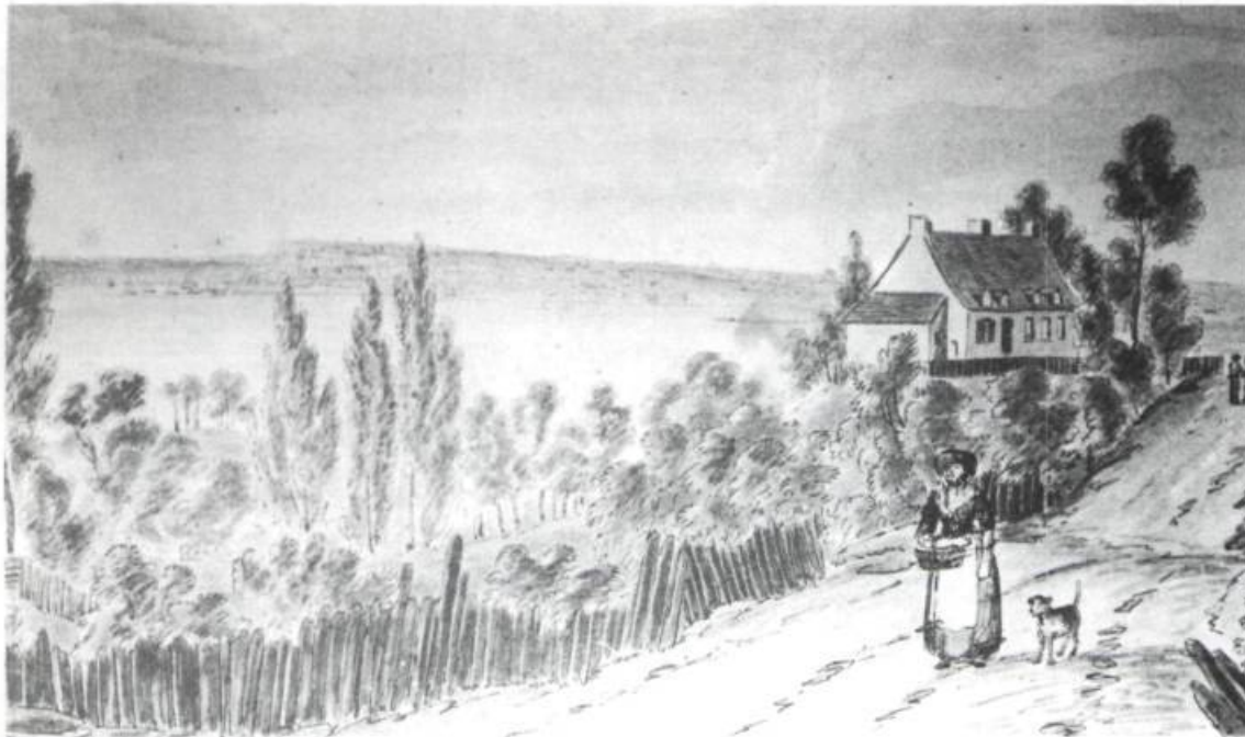
Aperçu vers l'ouest d'une maison du bourg de Beauport, à partir du Chemin du Roy. Aquarelle de J. P. Cockburn aux environs de 1830.