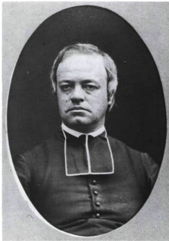
Monseigneur Thomas-Étienne Hamel, professeur de 1853 à 1875.

avec une collection évaluée à 2 500 livres en 1843. Le prestige de l'institution et de la science augmente également à la suite des expériences, souvent impressionnantes, réalisées en public; véritables spectacles auxquels assiste l'élite culturelle et cléricale de l'époque.