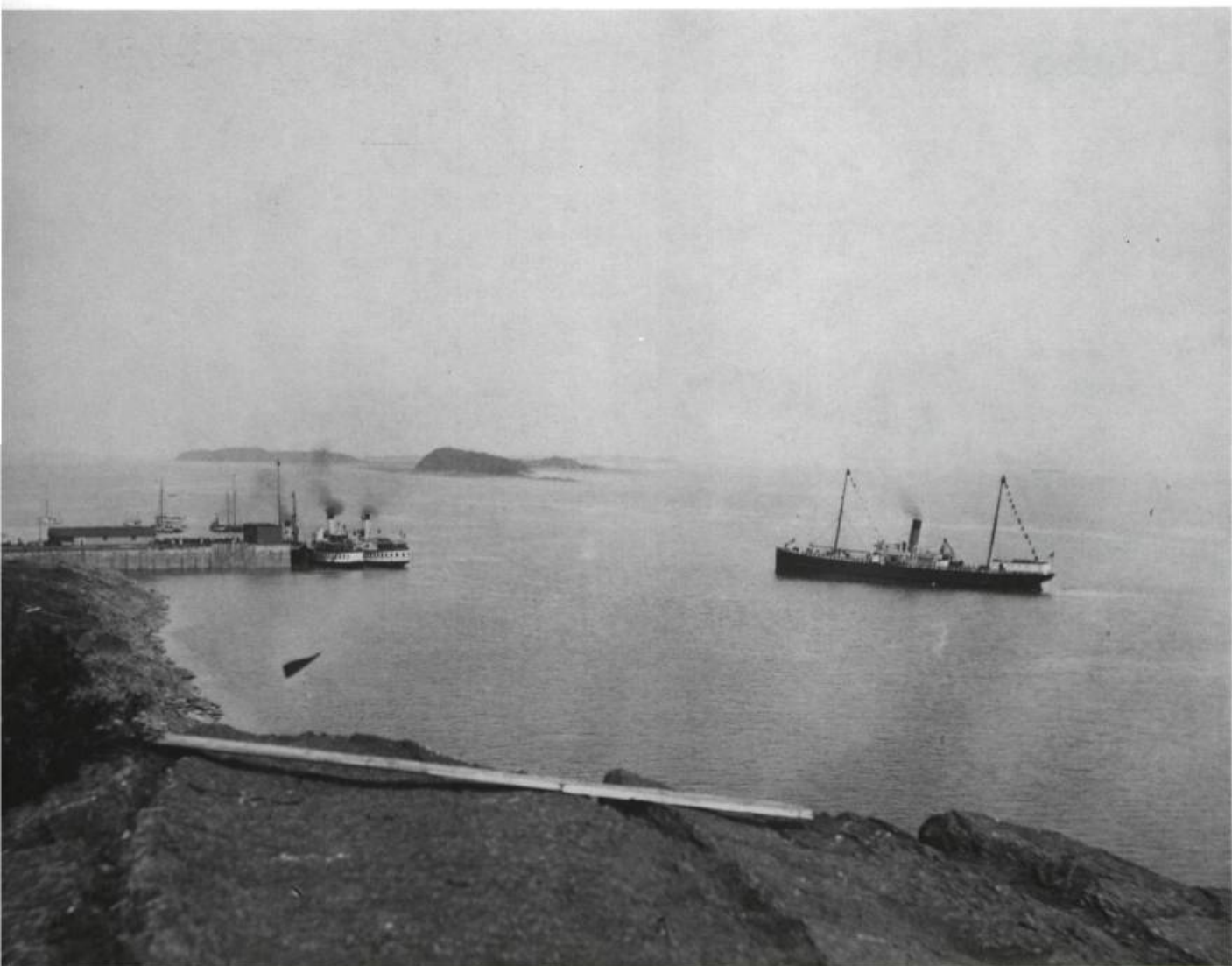
Le quai de Grosse Île.

importante épidémie que Québec n'a jamais connue. Au cours de cet été 1832 plus de 3 500 personnes succomberont à Québec, alors qu'à la Grosse-Île il n'en meurt qu'une trentaine. Le militaire responsable de l'île, le capitaine Reid du 32 e régiment de sa majesté, est complètement débordé. En plus d'être incapable d'obliger les bateaux à arrêter sur l'île, c'est le chaos qui règne; malades et bien-portants sont mélangés et personne ne veut approvisionner les bateaux mis en quarantaine. De plus, la révolte gronde chez les marins et les immigrants, ce qui oblige le capitaine Reid à donner l'ordre à ses soldats de tirer à vue, en cas d'escarmouche. À certains moments, plus de mille personnes se retrouvent en même temps sur l'île et le personnel médical, en nombre insuffisant, n'arrive pas à inspecter tous les bateaux, ce qui cause des délais interminables.