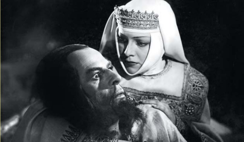
Scènes d'Ivan le Terrible, parties 1 et 2