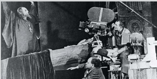
Sergeï Eisenstein (au centre) durant le tournage d' Ivan le Terrible

Le rôle de l'art dans l'épanouissement du régime soviétique fut tellement rebattu qu'il est aujourd'hui de l'ordre du mythe. Le camarade Lénine n'a peut-être jamais finalement prononcé sa phrase iconique « le cinéma est pour nous, de tous les arts, le plus important », qu'importe: comme on l'affirme dans The Man Who Shoot Liberty Valance , quand la légende dépasse la réalité, on publie la légende! Il demeure que le septième art représentait un formidable moyen de communication dans une contrée kilométrique. C'est dans ce contexte que s'inscrit Eisenstein. Pur produit de son époque, il débute alors que les propagandistes sont recrutés dans les plus hauts cercles de l'avant-garde. Ses dispositions esthétiques cadrent parfaitement avec la rhétorique révolutionnaire: des images-chocs, un montage expressif, une géométrie rigoureuse dans la composition. Si cette signature explose dans La Grève et Le Cuirassé Potemkine , elle suivra le réalisateur tout au long de sa carrière.